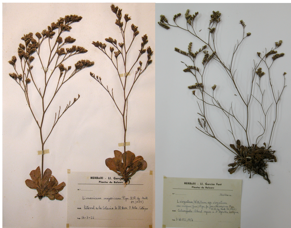
Fig. 3. Plecs del gènere Limonium de l'herbari personal de Llorenç Garcias i Font, dipositat a la Societat d'Història Natural de les Balears. A l'esquerra, Limonium majoricum , espècie descrita per S. Pignatti a l'any 1955. Garcias, qui va recol·lectar i enviar plecs del gènere a l'especialista italià, indicà a l'etiqueta d'aquest espècimen que es tractava d'un "cotipus". Realment es tracta d'un isotipus (un dels plecs utilitzats en la descripció), corresponent perfectament la data i localitat amb el que indicà Pignatti en la descripció de l'espècie. A la dreta, Limonium virgatum subsp. virgatum var. majus fa. pseudocaspium , tàxon també descrit per Pignatti al 1955. En aquest cas, Garcias indicà que es tracta d'un isotipus.

Fig. 3. Sheets of the genus Limonium from the personal herbarium of Llorenç Garcias i Font, placed at the Society of Natural History of the Balearic Islands. On the left, Limonium majoricum , species described by S. Pignatti in 1955. Garcias, who collected and sent herbarium sheets of the genus to the Italian specialist, indicated "cotype" in the label of this specimen. Actually, this is an isotype (one of the sheets used in the description), with a perfect coincidence in the date and collection locality with the indicated by Pignatti when describing the species. On the right, Limonium virgatum subsp. virgatum var. majus fa. pseudocaspium , taxon also described by Pignatti in 1955. In this case, Garcias indicated "isotype".