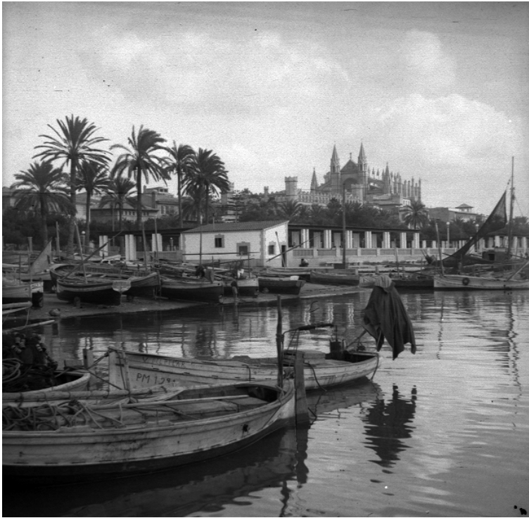
Fig. 1. Imatge del port de Palma a la dècada dels anys 50, amb La Seu al fons.

Deixant Alcúdia, amb una mica de malenconia, el 5 de juny vaig tornar a Palma. Trobada una habitació per a la nit, vaig deixar el meu equipatge i em vaig prendre una mica de temps per veure la ciutat. No coneixia a ningú, i podia passejar tranquil·lament, sense cap compromís. Vaig quedar sorprès per l'abundància de vegetació subtropical als jardins i avingudes. La ciutat té un estil molt particular, si més no al centre, tan diferent del de les ciutats de terra ferma. Per damunt de tot, domina la ciutat la silueta de l'esplèndida catedral. Encara vaig tenir temps per anar a Porto Pi, i vaig fer una curta passejada pels seus roquissars.