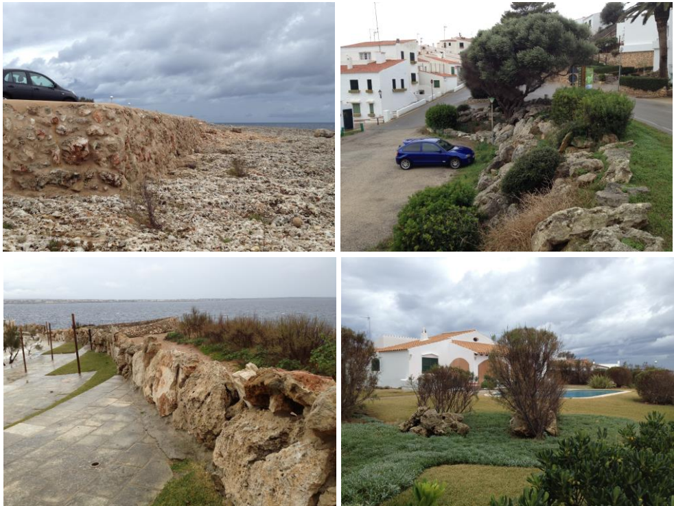
Fig. 4. Utilització de blocs associades per a reblits de carreteres (superior esquerre), estabilització de talussos (superior dreta), construcció de parets (inferior esquerra) o amb finalitats ornamentals (inferior dreta).

Aquest treball es configura com un document de partida sobre els processos erosius als penya-segats de Menorca que presenten activitat, amb base a la realització d'enquestes, i la ubicació de les