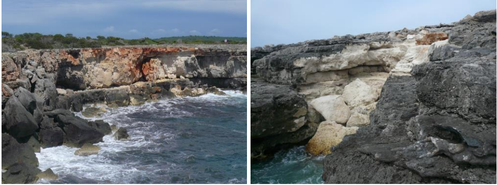
Fig. 1. Els denominats “blancs”, senyals de recents caigudes de blocs que encara no han estat colonitzades per cianofícies i/o líquens endolítics. Costa Sud de Ciutadella (esquerra). Costa S de Sant Lluís (dreta).

Fig. 1. Image of “whites”, signs of recent falls of blocks that have not yet been colonized by cyanophyta and / or endolithic lichens. South Coast of Ciutadellat (left). Coast of Sant Lluís (right).