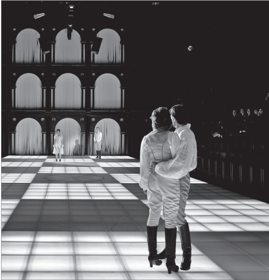
■ Yvonne, princesa de Borgonya , de Witold Gombrowicz. Teatre Lliure, març de 2008.

personatge d'Yvonne té el seu contrapunt en Isabel (Cristina Genebart), que suscita l'atracció positiva del príncep. Tal vegada és paradoxal que aquesta, que precisament podria veure-la com a una rival, sentit així el major desig de desfer-se'n,