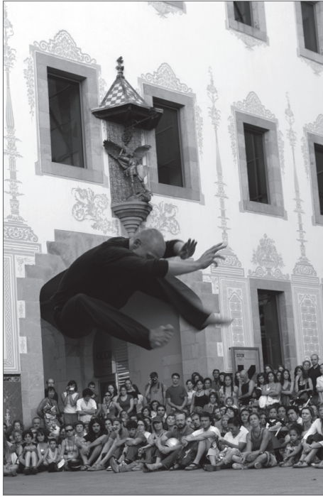
■ Dies de Dansa-07, al Centre de Cultura Contemporània de Barcelona.