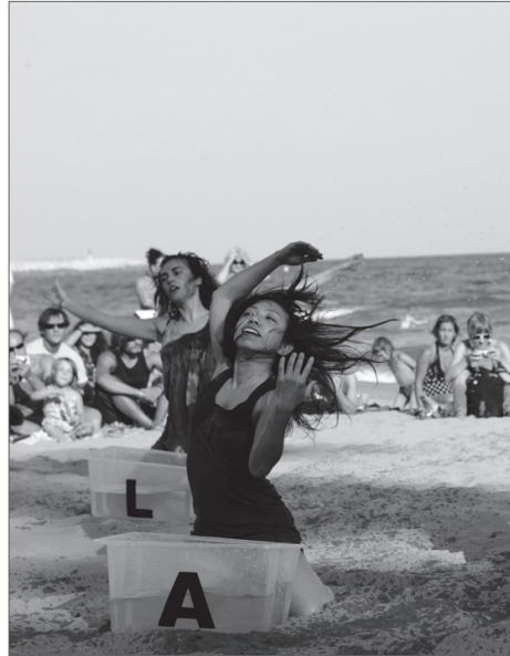
■ Dies de Dansa 2007. Platja de Sitges.

dijous de 16 a 20 hores de la tarda. També les acadèmies de dansa privades contribueixen a crear una teranyina cada cop més visible de gent que, perquè li agrada la dansa (sigui de l'estil que sigui), també en consumirà.