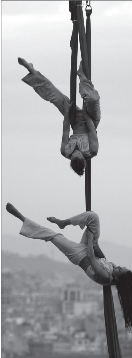
■ Dies de Dansa 2007. Piscines Picornell (Montjuïc). (Associació de la Marató de l'Espectacle)

de Professionals de la Dansa de Catalunya amb el desig d'unificar el col·lectiu i de vetllar pels propis interessos. I com havia passat en la Barcelona dels anys vint, quan el jazz i el tango van arribar a la metròpolis per no marxar-ne ja mai més, la ciutat tornava a sentir-se avantguardista, cosmopolita i moderna.