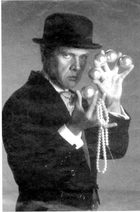
Hausson a la imatge promocional d'El criptograma vermell o Els rituals de Moc-te-zuma, escrita i dirigida per Hermann Bonnín. L'obra es va representar entre els mesos de setembre i novembre del 2001 a l'Espai Escènic Joan Brossa.