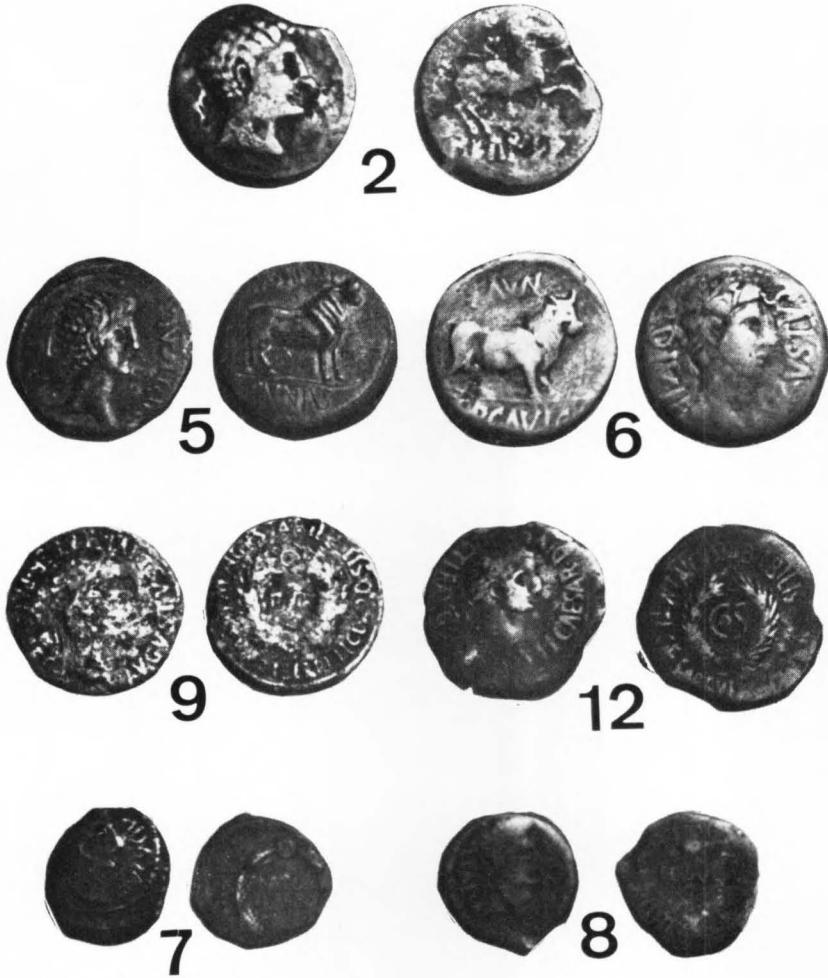
LAMINA III Reducidas