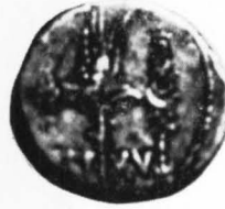
LAMINA I Aumentadas