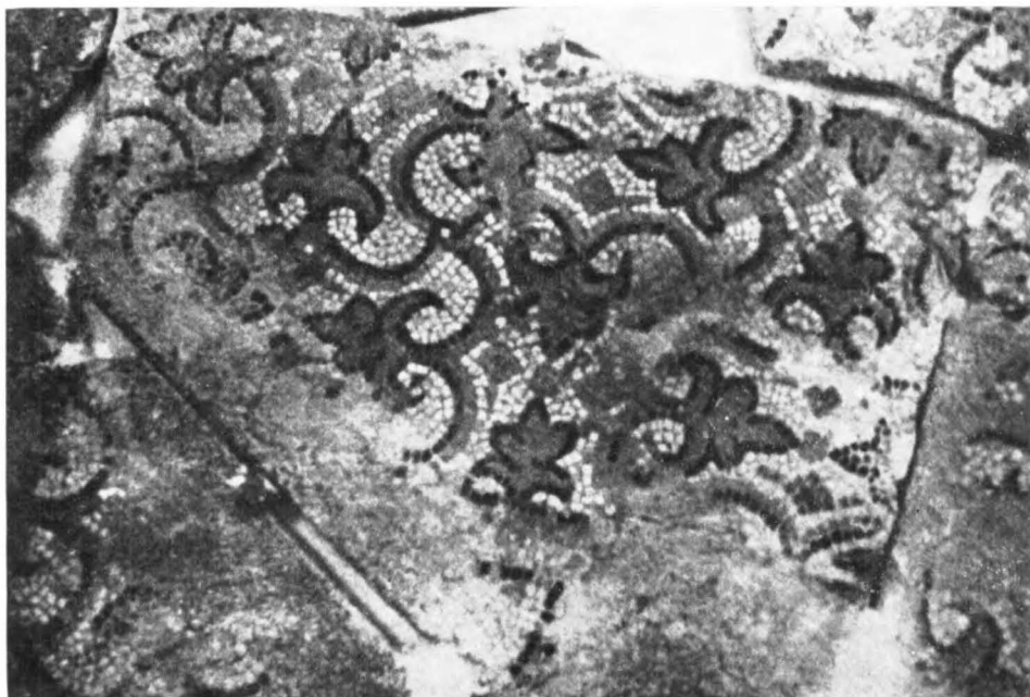
2. Museu de Manacor. Mosaïc de la basílica de Son Peretó. (Segons PALOL, Notas... , cit., làm. XVI, 2.)