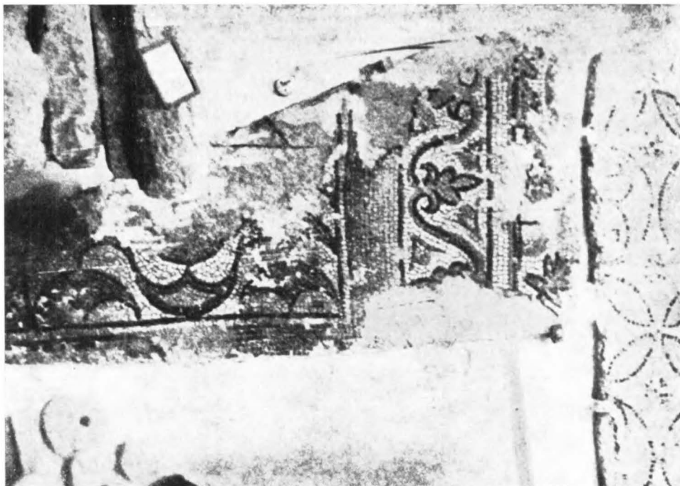
1. Museu de Manacor. Mosaïc de la basílica de Son Peretó. (Segons PALOL, Notas... , cit., làm. XVI, 2.)