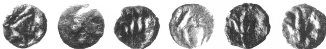
Anversos y reversos de monedas de cobre de Rhode, halladas en las excavaciones (diám., 9/10 mm.).

Salvo la n.º 4, las monedas de este tipo proceden del estrato II de excavación, mientras que las piezas que luego se inventariarían aparecen en el estrato III. No debe-