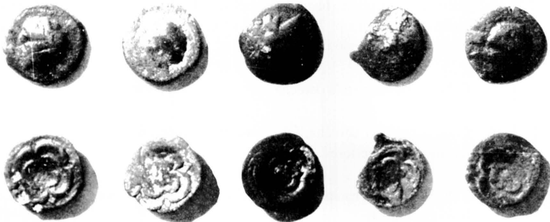
Monedas de bronce, de Rhode, halladas en las excavaciones, con la rosa del reverso vista por encima

Anverso y reverso son de los mismos cuños de la moneda n.º 8. - Calle frente a H. 19. Estrato III; 3-7-1964.