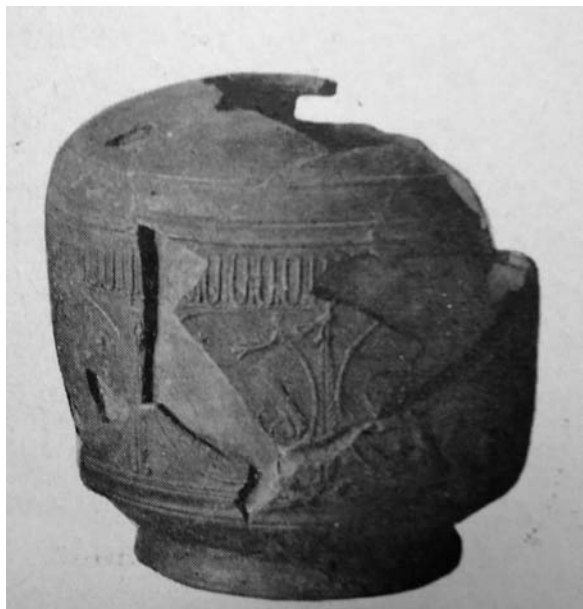
Fig. 4. Pieza de Montans (Durand-Lefebvre, 1954: 75, fig. 1, n.º 3).

sobre vasos de Montans (1954: 75, fig. 1, n.º 3). El autor lo clasificaba como «no identificado». Este mismo recipiente aparece en un trabajo de Romero Carnicero (1983: 130-131) como una lagena con una forma parecida a la Hisp. 20 (fig. 4).