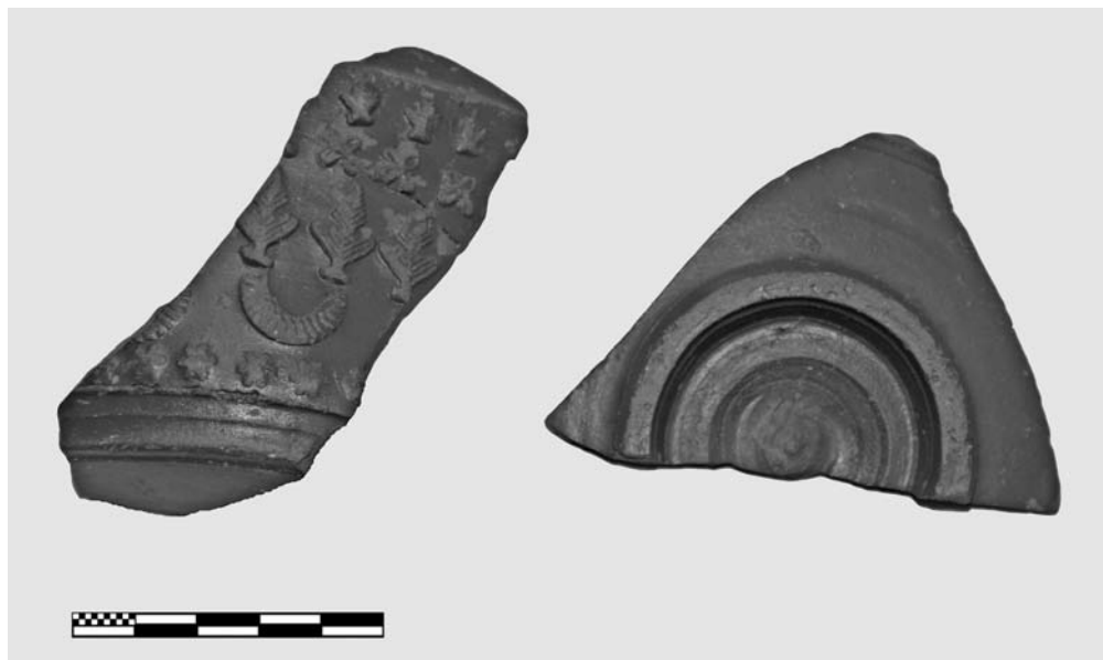
Fig. 3. Fotografía de la superficie exterior de la pieza de León que aquí presentamos.

voco de que nunca estuvo expuesta a la vista. Ambas características, ausencia de engobe interior y carena reentrante en la parte superior permiten proponer con cierta seguridad que se trata de una forma cerrada, probablemente una jarra, cuyos rasgos morfológicos no tienen paralelo alguno, hasta el momento, en las producciones de sigillata hispánica.