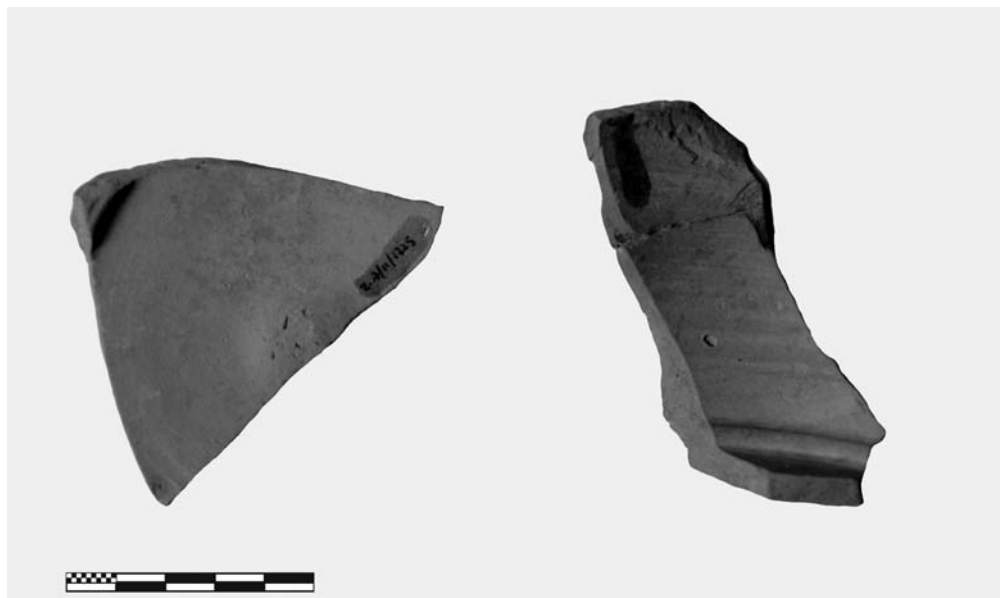
Fig. 5. Fotografía del interior de la pieza de León que aquí presentamos, donde se pueden apreciar las líneas de torno y la ausencia de engobe.

de tipo productivo. Su decoración, así como el más que probable empleo de un molde de una Hispania 30 para su elaboración, proporciona un marco temporal bastante general, que podemos centrar durante el último tercio del siglo I d.C. (Mayet, 1984).