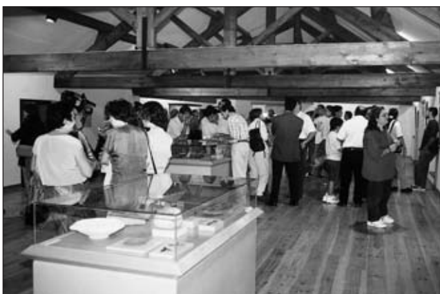
Acte de presentació i inauguració de l'exposició L'urbanisme ibèric a la Serreta , al Museu Arqueològic de Crevillent.

L'Ajuntament de València va sol·licitar a l'Ajuntament d'Alcoi el préstec temporal de l'escultura de bronze El primer tumbo , obra de Marià Benlliure, que és propietat de la Col·lecció d'Art de l'Ajuntament d'Alcoi, perquè aquesta figurara en una exposició monogràfica que sobre aquest artista va tenir lloc a l'Almodí de València durant el mesos de març i abril de 1996.