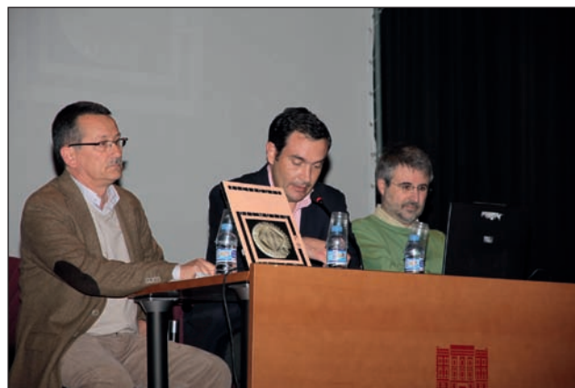
Acte de presentació del núm. 17-18 de la Revista del Museu.