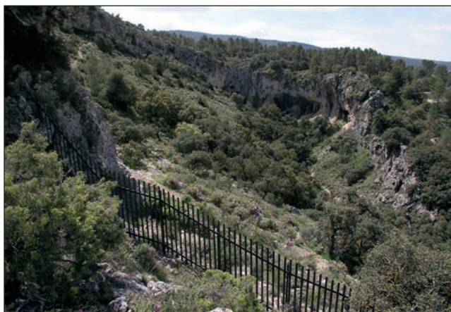
Vista del nou tancament del vessant del barranc de la Cova Foradada, per a la protecció dels abrics de la Sarga.

Per acabar aquesta introducció, cal que agraïm el suport de la Regidoria de Patrimoni Històric de l'Ajuntament d'Alcoi, i hem de valorar positivament la col·laboració i el treball de l'equip humà del Museu.