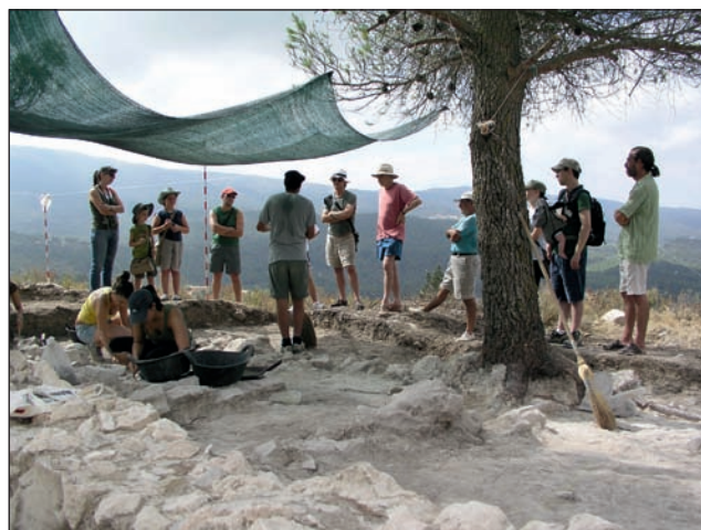
Visites al jaciment del Puig durant les Jornades de Portes Obertes.

Una part important de les despeses hagudes amb motiu d'aquest programa de visites a les pintures de la Sarga, van