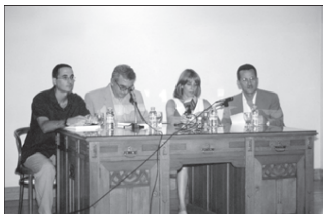
Presentació del llibre "La organización del territorio en el área central de la Contestania Ibérica".