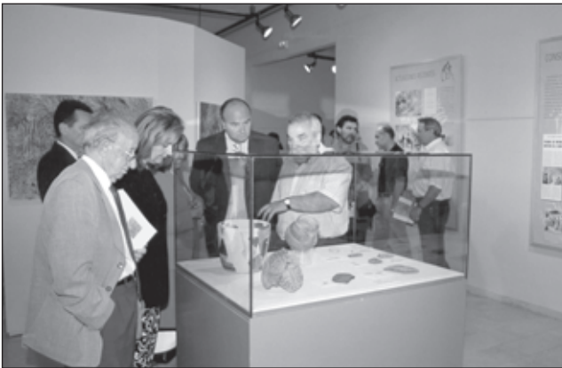
Acte inaugural de l'exposició "La Sarga. Arte rupestre y territorio".