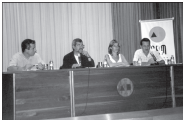
Presentació del llibre "Les pintures rupestres de la Sarga. Quadern de camp".