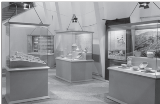
Exposició "La vida als castells" i maqueta del castell de Barxell.

* mitjana diària anual.....14,67 visites