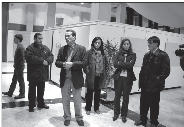
Acte inaugural a Crevillent de l'exposició La Sarga. Arte rupestre y territorio .

* mitjana diària anual.....13,83 visites