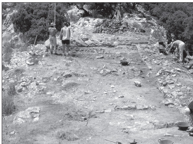
Treballs d'excavació a l'àrea del santuari de la Serreta (Alcoi, Cocentaina, Penàguila).