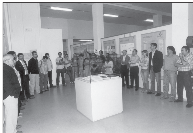
Acte inaugural a Callosa d'En Sarrià de l'exposició La Sarga. Arte rupestre y territorio .

Con ja és habitual, molts dels grups que visiten les sales del Museu, principalment els escolars, han rebut una atenció personalitzada per part del personal del Museu, i enguany s'han comptabilitzat fins a 92 visites guiades.