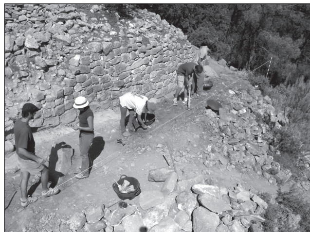
Treballs d'excavació a la torre ibèrica del Puig (Alcoi).