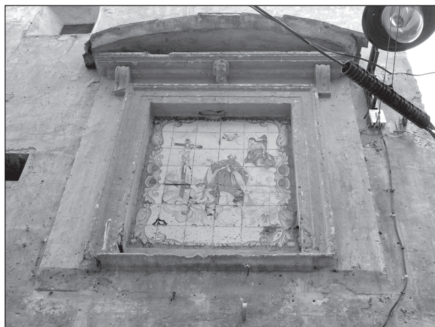
Plafó ceràmic de sant Agustí (carrer Ambaixador Irlès cantonada amb el carrer Sant Agustí).