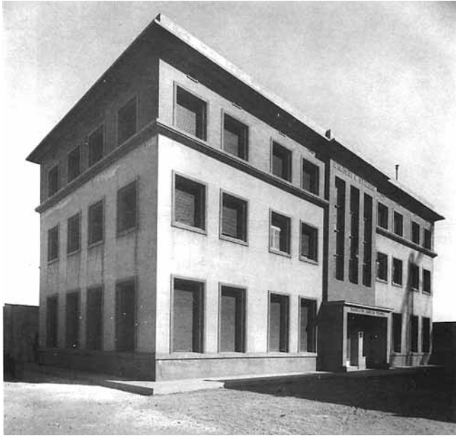
FIGURA 5. Primer edifici de l'IMIM, avui ja desaparegut, davant de l'actual Hospital del Mar (amb l'autorització de l'IMAS)

biomèdica i que a partir del curs 2008-09 s'anomenen de Biologia humana.