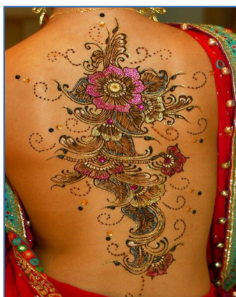
Ilustración 1.3. Tatuaje de inspiración hindú

El tatuaje en la Polinesia se desarrolló en las islas del Pacífico durante miles de años, alcanzando un elevado grado de elaboración y belleza en sus diseños geométricos. La secuencia de estos trazos estaba predeterminada y cada parte tenía su nombre. El diseño se elegía con sumo cuidado y cumplía la función de signo de identificación personal (Reisfgld, S; 2004). Podemos suponer que el tatuaje era un emblema de rango, ya que muchos jefes y personas importantes estaban notablemente decorados. Además, los nativos tenían un interés especial en tatuar a los visitantes occidentales, quienes actuaban como si fueran príncipes entre los “salvajes”. Sin embargo, había también personas de muy alto rango que no estaban tatuadas y en algunos casos las mujeres estaban tatuadas y los hombres no, y viceversa. Además de la asociación del tatuaje con el rango, los observadores occidentales frecuentemente indicaron que los hombres no tatuados, especialmente en Samoa, Tonga y las Marquesas, eran tratados con desprecio por las mujeres, que les negaban sus favores. Un buen número de testimonios de hombres europeos, que adoptaron de buen grado o a la fuerza la forma de vida polinesia, cuentan que para tener relaciones sexuales con las mujeres locales debían tatuarse (Duque, P; 1997).