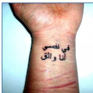
Ilustración 1.2. Tatuaje de inspiración árabe

En India el tatuaje tiene una larga trayectoria, El tatuaje decorativo entre las comunidades nómadas ha existido por siglos. Sus integrantes se tatuaban como marca de identificación. También se tatuaban sus piernas con diseños geométricos o imágenes de animales. El tatuaje varía su significado según las castas: cuanto más alta la casta menor cantidad de diseños. El dolor de la incisión es una fracción más del sufrimiento en la tierra, que servirá en el cielo como pago de los pecados (Duque, P; 1997).