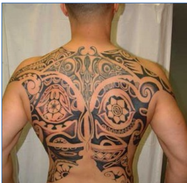
Ilustración 1.4. Tatuaje de la Polinesia.