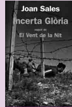
Incerta Glòria (seguit de El Vent de la Nit ) Club Editor. Barcelona, 1999

Si Incerta Glòria retrata la guerra, la vida de Joan Sales reflexa la generació que la va viure. Educat en un ambient catalanista, la fascinació inicial pel marxisme es va diluint per la creixent influència del PCE en el comunisme català. Coneix el front a la Columna Durruti, la Columna Macià-Companyes i com a comandant de l'Exèrcit Republicà; i la repressió amb les purgues estalinistes i l'exili de la derrota. Passà per París, Haití i Mèxic, on aprèn l'ofici d'editor —amb la revista Quaderns de l'Exili i la publicació de nombrosos clàssics catalans que conrea un cop torna a Barcelona el 1948. Ferran Soldevila, Mercè Rodoreda, Llorenç Vilallonga o Màrius Torres són alguns dels autors que publica mentre impulsa una carrera literària que culmina amb Incerta Glòria .