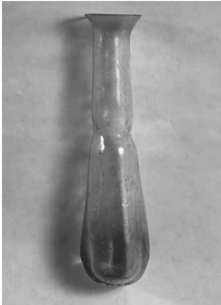
[Fig. 2] Ungüentari. MEV 8351

Tots, sencers o no, corresponen a la forma 8 d'Isings que aquesta autora considerava pròpia del segle I i que defineix com a « tubular unguentarium with constriction ».[4]