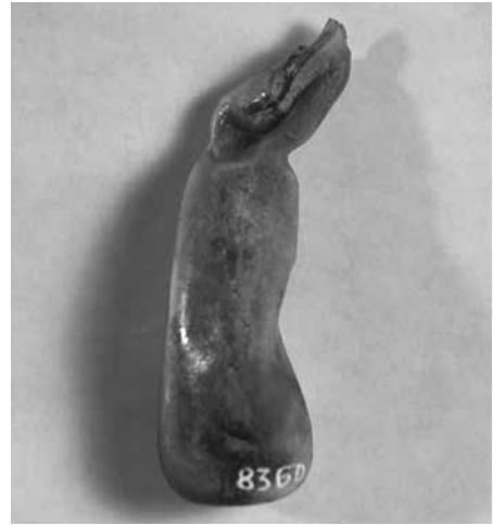
[Fig. 3] Ungüentari, MEV 8360.

Tanmateix, podem intentar anar un xic més enllà. Si donem un cop d'ull a la Carta Arqueològica publicada el 1984, al terme de Corçà s'esmentaven dos establiments rurals d'època romana: Puig Rodon, a nord-est del poble, una vil·la coneguda d'antic i explorada arqueològicament, i Santa Cristina, a ponent, no gaire lluny de Monells.[81] Aquest panorama no ha variat en aquest darrer quart de segle. Si bé és impossible saber amb seguretat a quina d'aquestes dues estacions relacionar la nostra tomba que, per què no?, podria no tenir res a veure ni amb una ni amb l'altra, val la pena reflexionar-hi un xic per intentar anar més endavant.