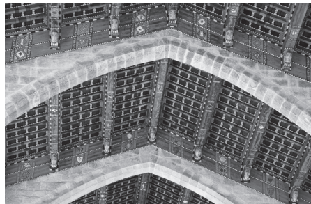
[Fig. 2] Un dels trams del teginat on s'aprecien les bigues i plafons.

Cada un dels cinc trams tenen com a sustentacle principal set bigues de secció rectangular que s'assenten sobre els corresponents caps de biga [fig. 2]. Aquestes utilitzen com a sòcol uns taulons a fil o jàsseres, és a dir, unes taules col·locades seguint el pendent de l'extradós de l'arc diafragma, de pedra. En sentit perpendicular a les bigues hi van onze cairats per tram, que suporten els panells plans. Aquests panells són de quatre quadrats, delimitats per les bigues i els cairats; segurament aquesta compartimentació és únicament pictòrica, ja que es tracta de taules rectangulars encaixades sobre els esmentats elements sustentadors.