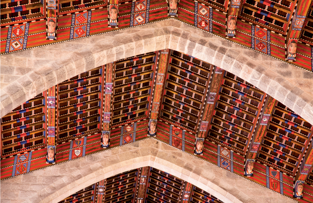
Un dels trams del teginat on s'aprecien les bigues i plafons. J. Barrachina, «El teginat de l'església...», fig. 2.