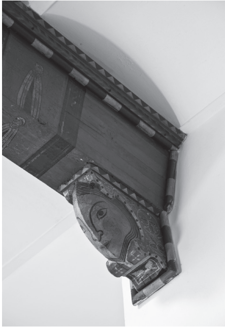
[Fig. 3] Una de les bigues i mènsoles conservades fora de l'àmbit del teginat restaurat.

sobre daurat (tan repetides en d'altres sostres catalans, potser com a heràldica evocativa). Aquest disseny correspon únicament a la biga central de cada tram; les sis que resten canvien el frare per un escut heràldic. Els cairats i els panells tenen una decoració senzilla, geomètrica.