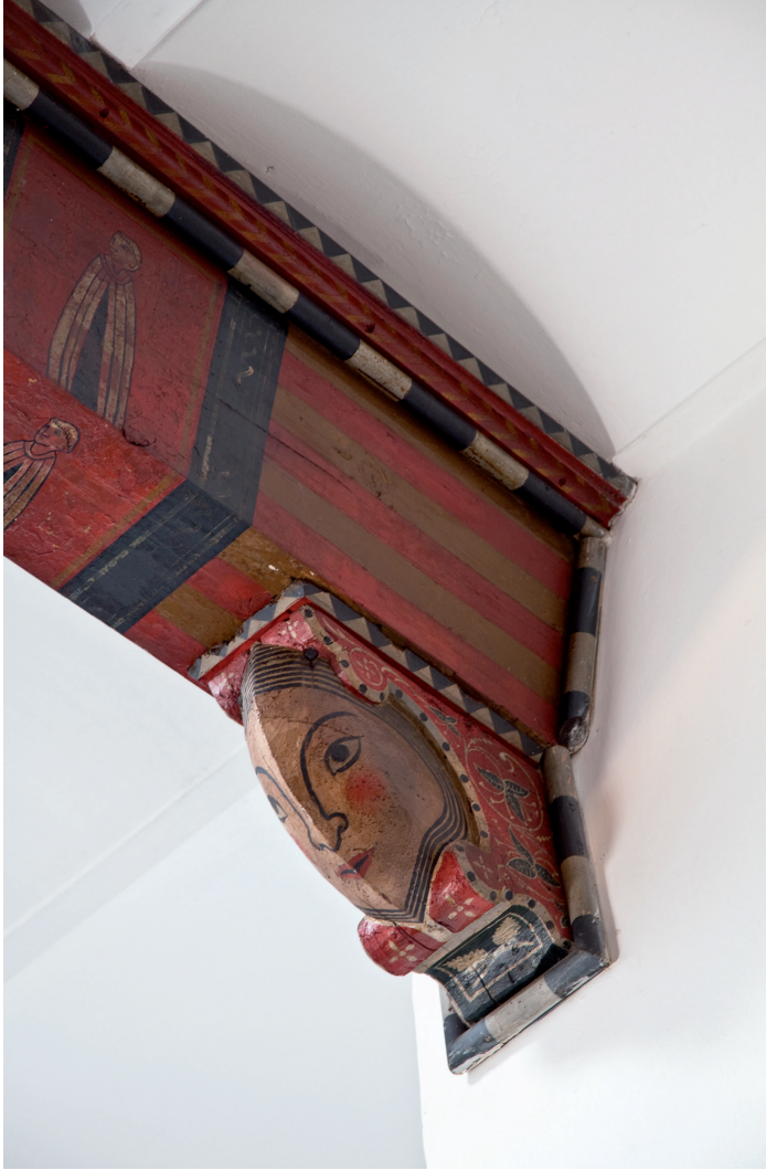
Una de les bigues i mènsules conservades fora de l'àmbit del teginat restaurat. J. Barrachina, «El teginat de l'església...», fig. 3.