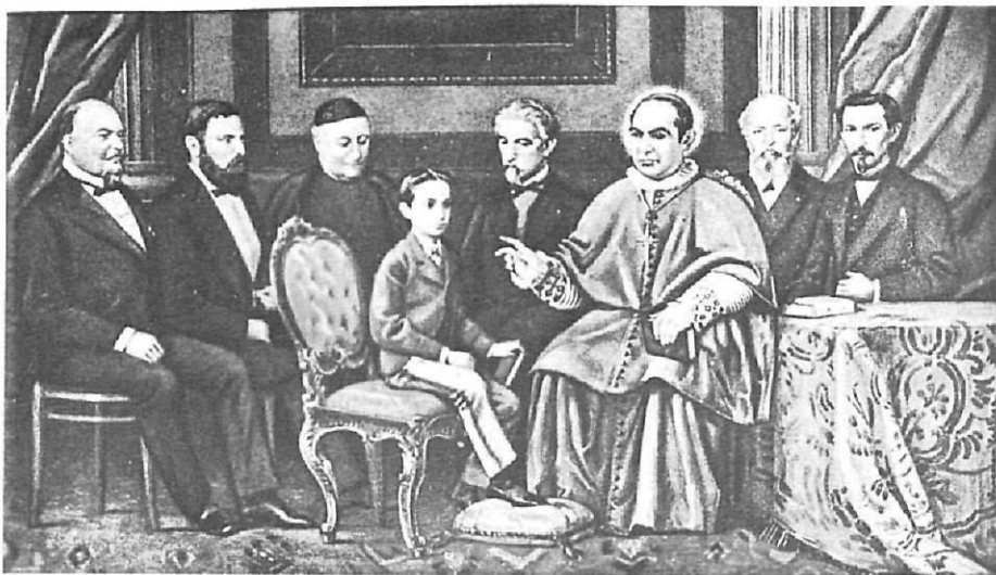
El fundador de l'Orde Cordimariana, sant Antoni Maria Claret, preparant el Príncep d'Astúries, després Alfons XII, per a la Primera Comunió que va rebre de mans de Pius IX.