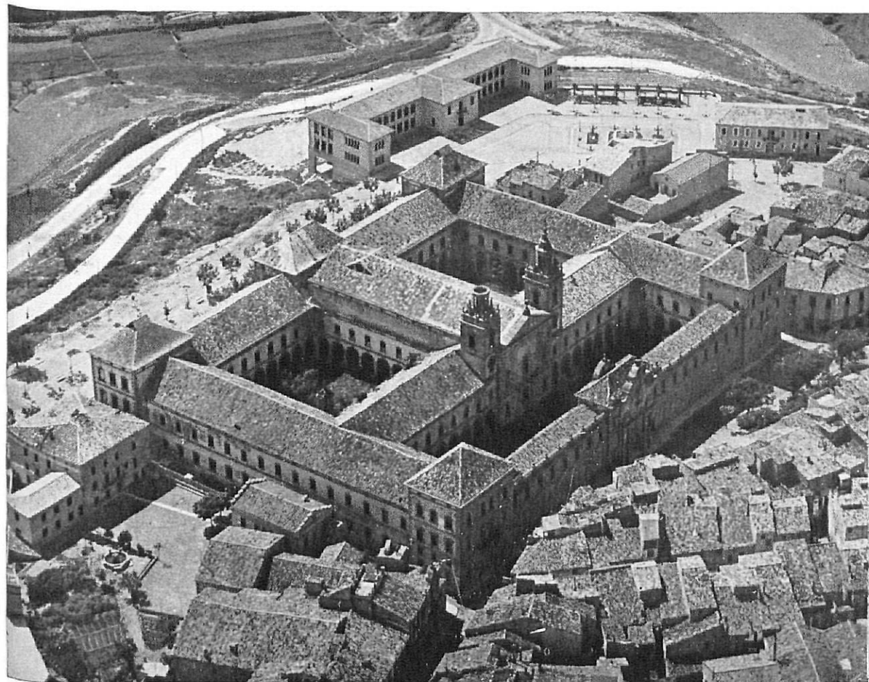
Vista aèria de la Universitat, abans de restaurar les torres.