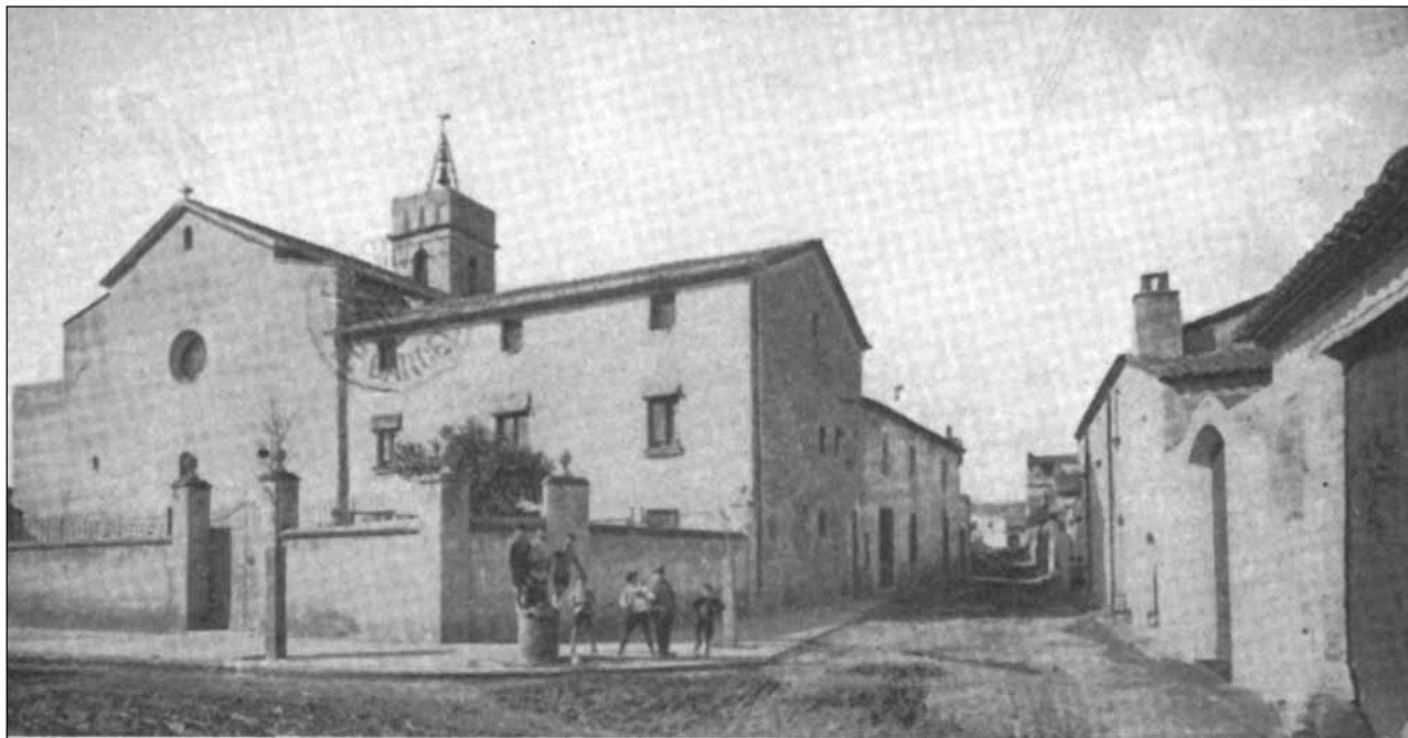
Fotografia de la rectoria i de part de l'església de Sant Joan Baptista de Viladecans, cap a l'inici del segle XX. L'angle de visió ens permet observar la façana de l'antiga escola, a tocar de la mateixa rectoria, situada al carrer de la Muntanya. AMV-AI (Arxiu Municipal de Viladecans-Arxiu d'imatges). Fons Ajuntament de Viladecans. Autor: L. Roisin Besnard, Barcelona.

de juny al mes de setembre— quan les tasques de sega i verema als camps eren més intenses, ja que moltes famílies pageses o jornaleres veien força incompatible les feines agràries amb l'educació dels nois.