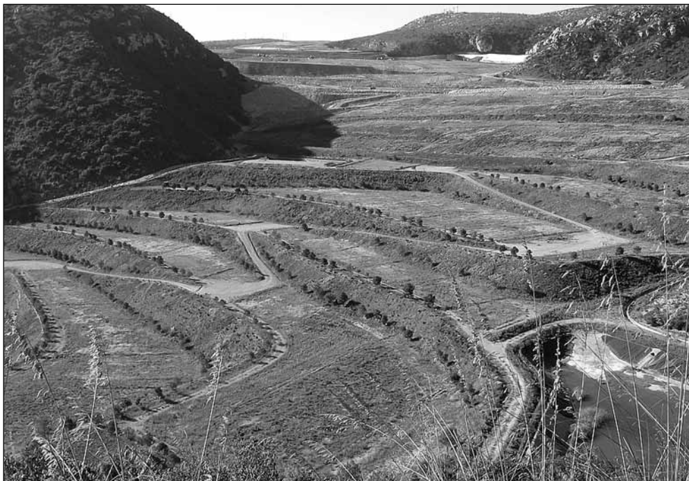
El fondo de les Terradelles un cop acabats els abocaments, l'any 2008. La vall acull actualment uns 80 milions de tones d'escombraries.

consistori local ja estava decidida: mesos després, l'alcalde —sector provinent de l'antiga Lliga— era cessat i, en lloc seu, va ser nomenat un directiu de Roca, Joan Jesús Muñoz Blay. A partir d'aquell moment els sectors dirigents locals es van desentendre del problema de l'abocador i, de fet, el 23 de març de 1972 el ple —amb el vot dels regidors abans opositors— concedí el permís de lliure trànsit pel terme als camions d'escombraries.