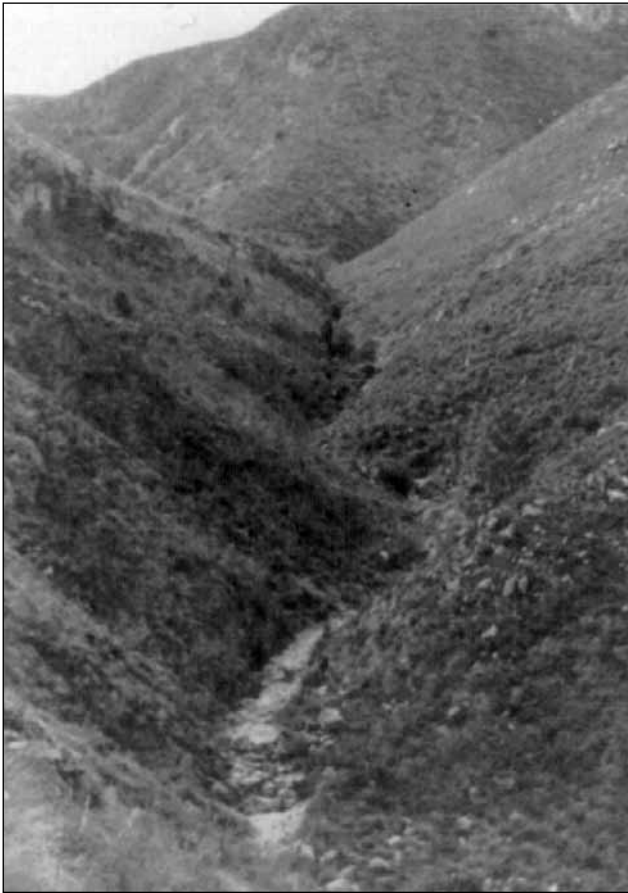
El fondo de les Terradelles abans que s'hi ubiqués l'abocador del Garraf, l'any 1972.

de concessió. A final d'any, el 27 de novembre de 1971, el plenari municipal barceloní va atorgar la concessió de l'abocador del Garraf a la unió temporal d'empreses formada per Fomento de Obras y Construcciones SA, Dragados y Construcciones SA, i Cooperativa de Usuarios del Servicio de Limpieza de Barcelona. El projecte tècnic d'abocador s'enllestí l'abril de 1972.