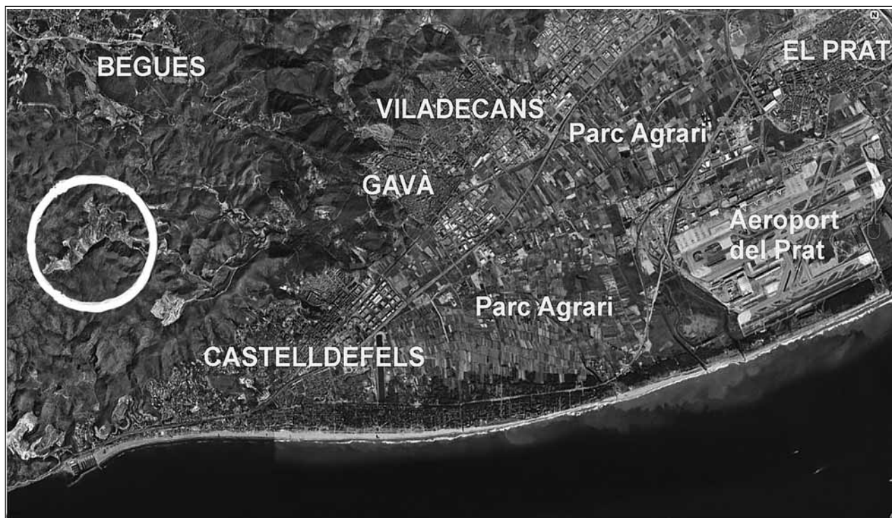
L'abocador del Garraf (dins del cercle) en el context del Delta del Llobregat. És notable l'espai afectat per l'abocador, ben visible des del satèl·lit. Foto: Google Earth, 2009.

a la mobilització popular. El 8 de febrer, Gavà va aparèixer plena de fulls volants convocant una manifestació davant l'Ajuntament per al dia 10. Els fulls volants, en català, van ser preparats a l'empresa Roca pels quadres opositors a l'alcalde d'aleshores. A les oficines de l'empresa, amb ple consentiment dels directius, també es prepararen les pancartes que van encapçalar aquella convocatòria, amb lemes com «Basuras no», «No queremos basuras», «No queremos ser el estercolero de Barcelona». 9 La Falange local també acordà amb les forces d'ordre la no intervenció durant la nit de la protesta. L'actitud passiva de la policia i la guàrdia civil contrastà vivament amb la brutalitat que havien exhibit, només tres mesos abans, a la mateixa factoria de Roca, en ocasió d'una vaga de treballadors, una de les més significatives del despertar obrer del Baix Llobregat. 10