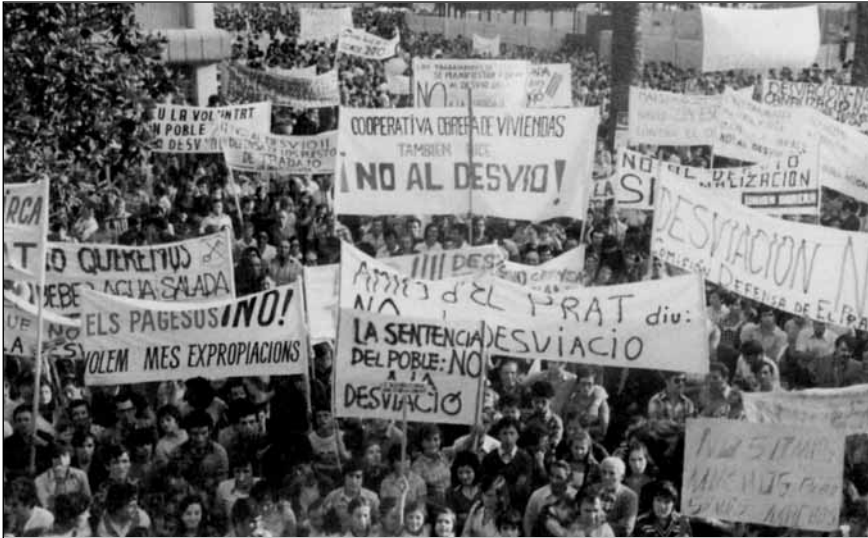
Manifestació al Prat de Llobregat en contra del desviament, el 17 de setembre de 1976.

L'Ajuntament del Prat, l'hospital de Sant Pau (amb terres al Prat afectades pel desviament) i un parell de particulars van interposar un plet davant del Tribunal Suprem. El tema, doncs, quedava judicialitzat.