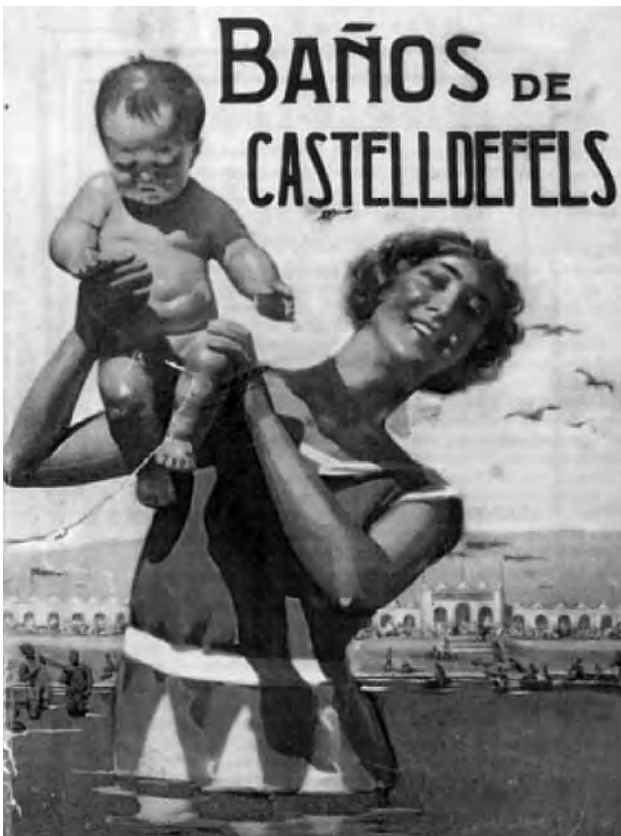
Figura 10. Portada del fulletó promocional dels Baños de Castelldefels, de 1930.

1936, indica fins a quin punt la platja de Castelldefels era, a cavall dels anys vint i trenta, un lloc d'estiueig privilegiat, tot i que de caire molt més popular que les colònies d'estiuejants de Begues i Gavà acabades d'esmentar. 21