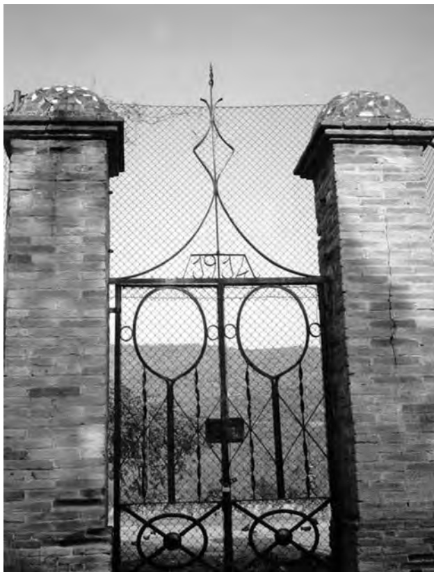
Figura 4. Porta de la pista de tennis, amb la data de construcció indicada.

“lux electrica fuit lecata”, como así lo recuerda una leyenda inscrita en la fachada posterior de la casa “pairal”».