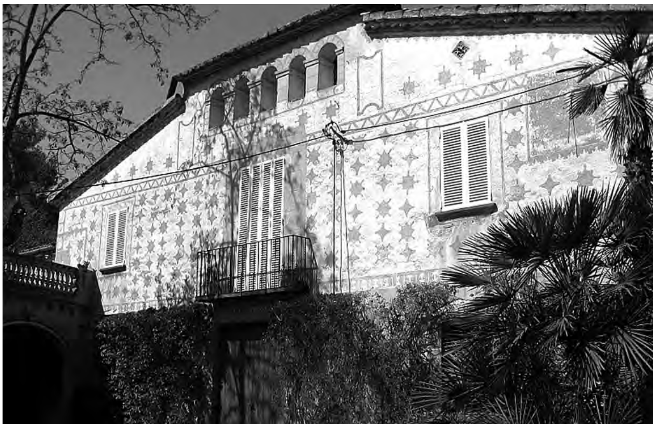
Figura 1. La masia de ca n'Amat, a Gavà, i antigament de can Ros de les Canals, presenta aquest aspecte, amb els esgrafiats a la façana típics del segle XVIII. Va ser reconstruïda el 1741, tal com indica una inscripció sobre la porta d'entrada.

com el turisme i l'esport, o instal·lacions com els parcs d'atraccions, hotels, balnearis, restaurants i casinos van genuïnament aparellats, i van deixar una empremta en el territori que avui encara és fàcil de resseguir.