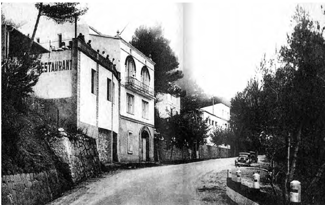
Figura 8. Gran Hotel Colònia Petit Canigó, retratat als anys trenta del segle xx.