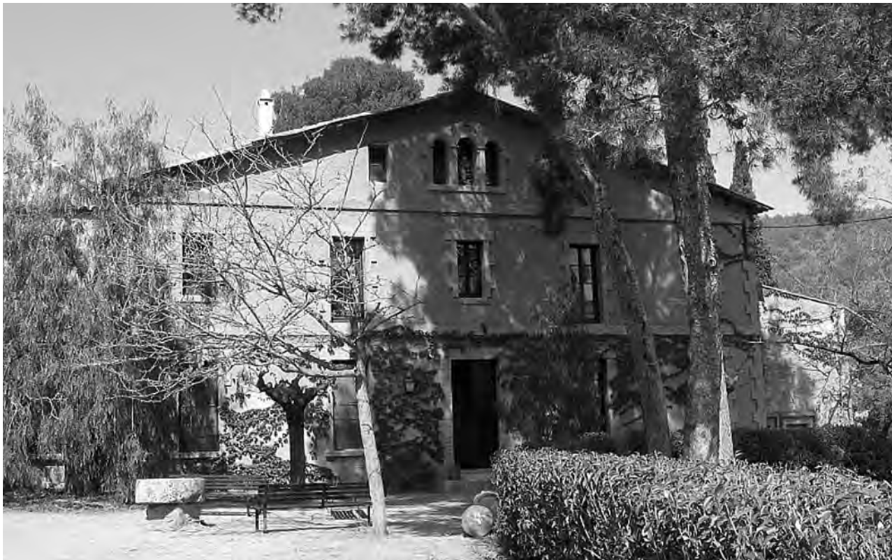
Figura 5. Una mostra dels xalets de la colònia Amat, de la Font del Ferro de Gavà, encara en actiu avui en dia.

l'any 1887, 14 els excursionistes que pugen a Begues just l'any després de fer-se la carretera de Gavà, esmenten el «châlet Amell» i el «châlet d'en Teodor Bosch», les primeres cases d'estiuejants de la localitat. L'autor, en descriure el poble, remarca que està «en situació incomparable: aires purs, quietud i vistes deliciosos. Aquí podrien venir els barcelonins a esbargir-se».