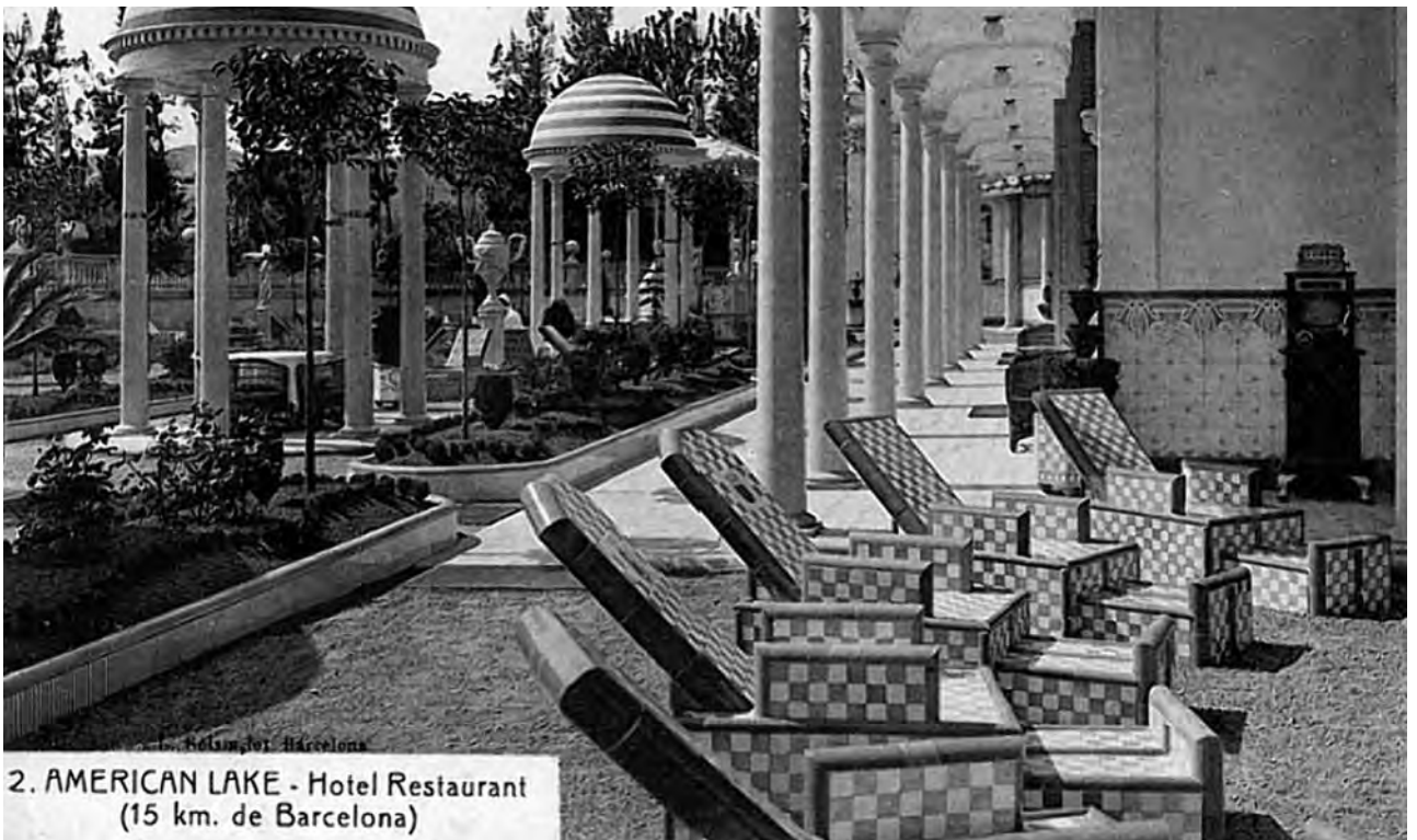
Figura 14. Imatge d'un dels pavellons del parc de l'American Lake de Gavà.