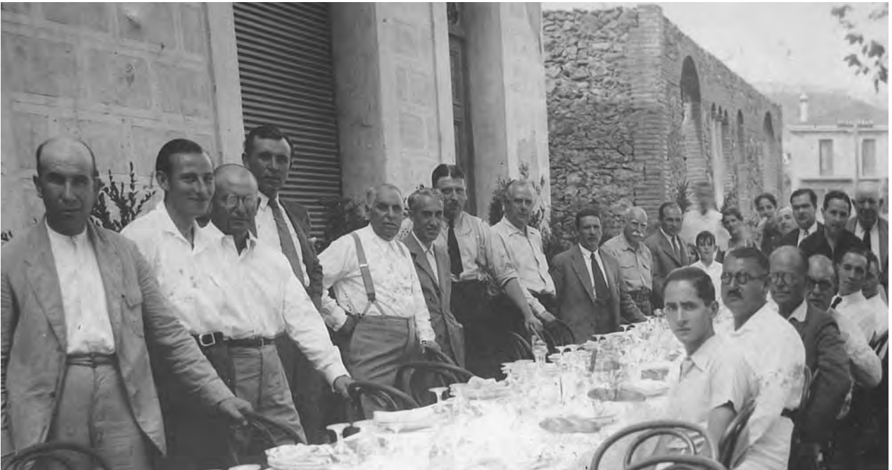
Figura 9. La colla de l'arròs, grup d'estiuejants d'on va sorgir la idea de construir la Cuca-fera, una de les primeres mostres de bestiar popular i tradicional de la comarca.