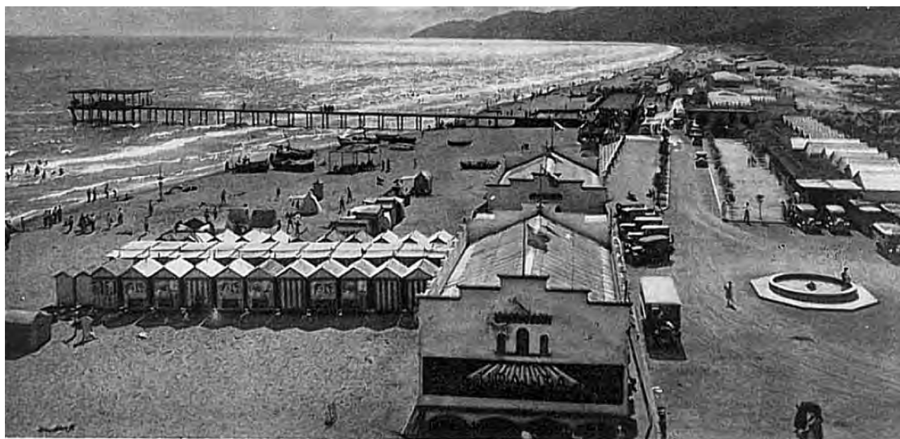
- BAÑOS DE CASTELLDEFELS L'AYA GIGANTE - PLATJA GEGANT