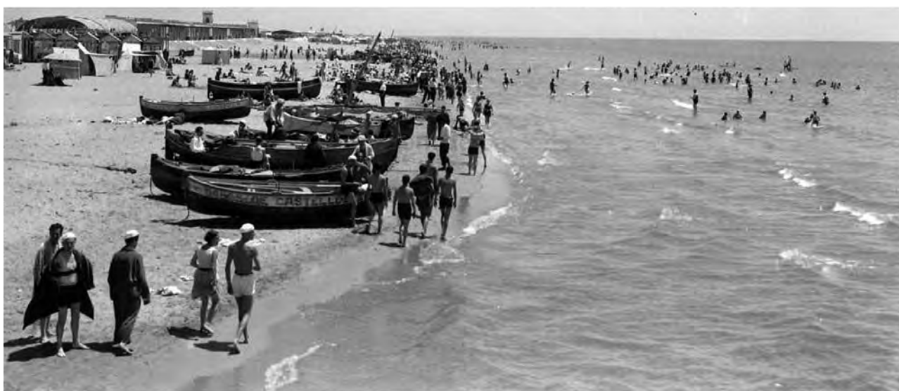
Figura 12. Una imatge de la platja de Castelldefels als anys trenta del segle xx, quan la convivència entre estiuejants i pescadors era encara una realitat.

parc, hi havia una ermita, un bosc enjardinat travessat per un riuet, un tancat amb cérvols i, envoltant la finca, les vies d'un petit carrilet, dos trenets, un amb el motor d'un Ford i l'altre amb el d'un Buick, amb vagonets descoberts i coberts, rèpliques dels trens de la línia de Vilanova, que passava per un túnel sinuós on hi havia diorames amb escenes d'història natural fets amb animals dissecats (tigres, cocodrils, óssos polars, lleons, cérvols...). Hi havia l'estació del trenet i un pas a nivell. Dels edificis grans, a