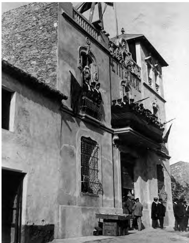
Figura 6. Festa d'inauguració del Petit Casal de Begues. Foto: cessione Centre d'Estudis Beguetans (Francesc Sánchez).

llargues excursions. La colònia d'estiuejants de Begues ben aviat contribuï a la difusió dels esports moderns com el futbol, amb la institució de tornejos, 16 i organitzà una sèrie d'esdeveniments socials que tenien per marc el nou Gran Hotel Canigó, com ara la festa de la Velleja, colònies per a sord-muts, o la festa de l'ombrel·la.