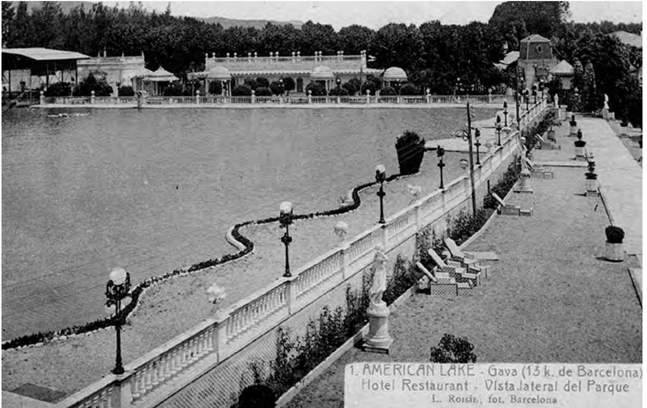
Figura 13. Imatge del llac de l'American Lake de Gavà.