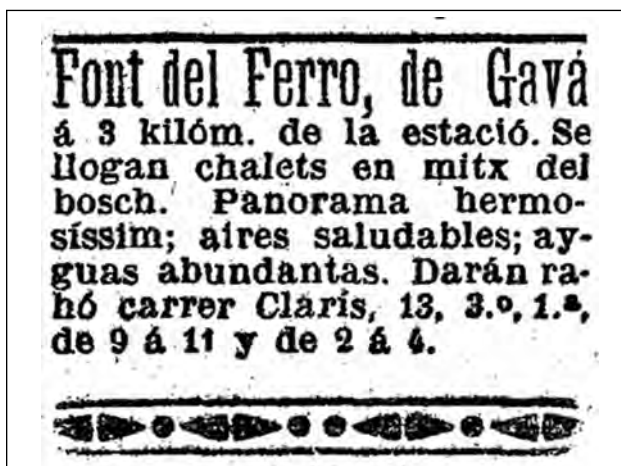
Figura 3. Text aparegut a La Vanguardia l'any 1911 per anunciar el lloguer d'habitatges a la Colònia Amat.

nades d'estiu s'hi congregaven fins a un centenar de persones. Una ressenya de l'any 1896 fa referència a aquesta colònia d'estiuejants: «Si bién ha refrescado notablemente el tiempo, continúan todavía entre nosotros algunas de las familias de la capital que vinieron aquí a pasar el verano; demora que sin duda sabrán aprovechar en recorrer los bosques inmediatos en busca de los sabrosos "rovellons" que pronto saldrán en abundancia, ya que llegó su temporada y el terreno se halla con la humedad y frescura que su aparición necesita. Y al mismo tiempo que practicando el ejercicio antes dicho podrán admirar las bellezas y tesoros naturales que contienen las montañas vecinas, desde algunos de sus elevados picos, como el Pla de las Bassas, Sant Miquel, Bruguers y algún otro [desde los que] se descubren deliciosos panoramas, y entre cuyos riscos y sinuosidades hay fuentes tan ricas como las del Mas Vilar, d'en Bru, y sobre todo la de hierro de casa Amat, cuyas aguas, según competente dictamen facultativo, contienen carbonato férrico y cloruro cálcico, gas, ácido carbónico y sales de magnesia y sosa, teniendo sobre las demás aguas ferruginosas la ventaja de que lejos de ocasionar restricción