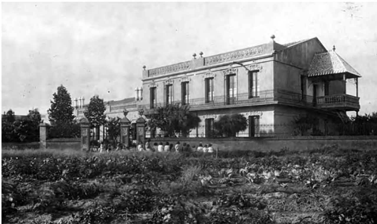
Figura 7. Hotel Petit Canigó, a Begues, l'any 1915.