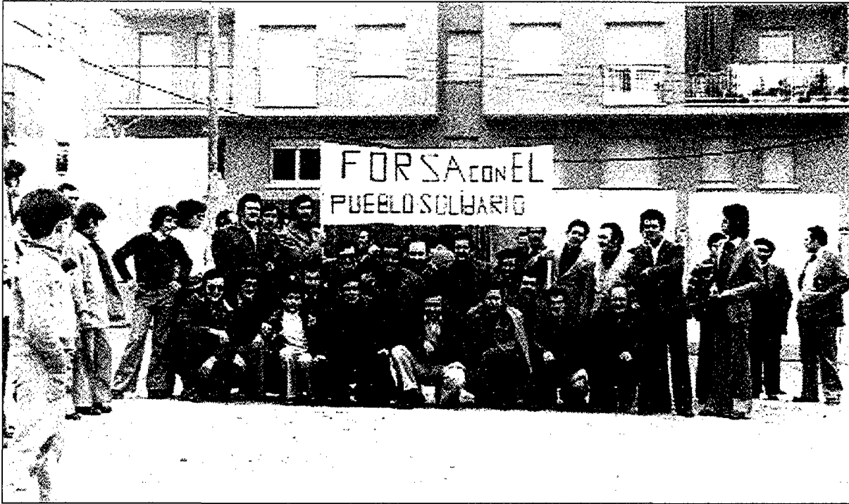
Grup de sindicalistes en suport als treballadors de FORSA durant una concentració en un dels diferents conflictes que es van produir durant la transició democràtica a la comarca (1975).

ca l'esquerra que proclamava la ruptura, ni ho ha estat posteriorment en els reflexos electorals durant la normalitat representativa. 7