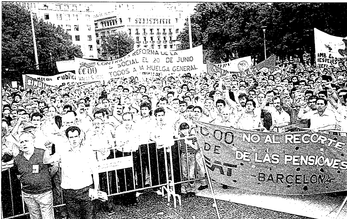
Concentració de treballadors del Baix Llobregat a la plaça de Catalunya de Barcelona contra la reforma de la Seguretat Social i la retallada de les pensions.

nitzacions són febles i la consciència encara és precària. Almenys la consciència radical, de rebel·lia. El país, en canvi, aspira a una democràcia normalitzada i aquest sentiment sí que és general. Avança de la mà de tothom: de la socialdemocràcia, de les altes finances, dels grups empresarials i multinacionals, de l'Església, fins i tot de bona part de l'Exèrcit. I també de l'esquerra més radical i de les organitzacions nacionalistes. I les eleccions es converteixen en un horitzó esperat per tothom i irreversible.