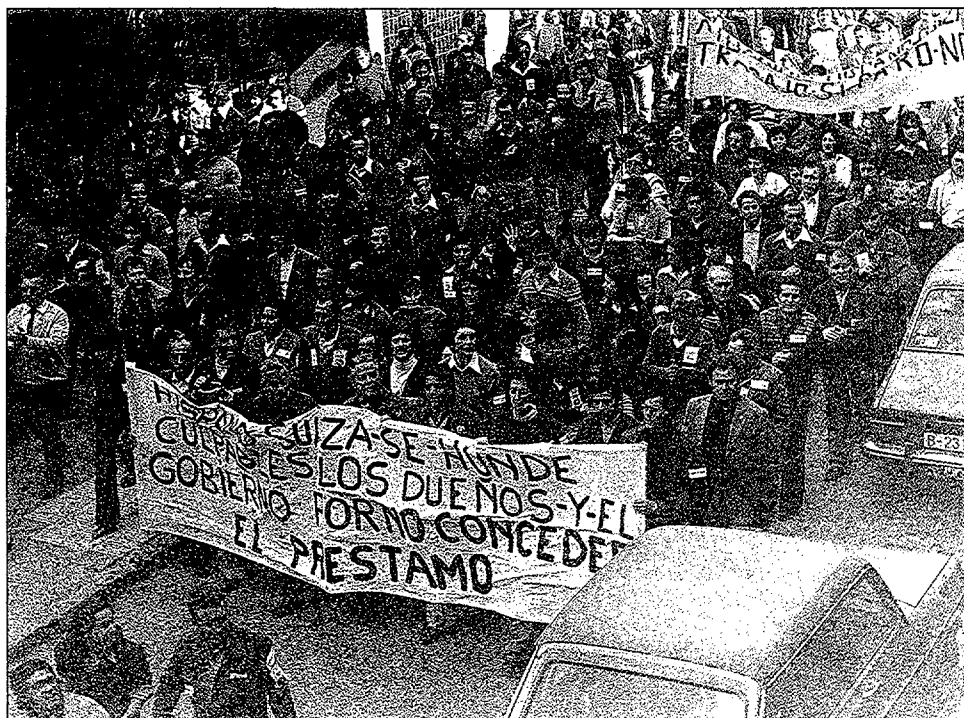
Una de les manifestacions de treballadors en defensa dels seus llocs de treball en els moments més durs de la crisi econòmica. (1978).