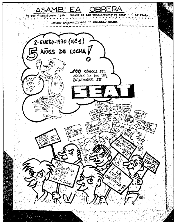
Revista d'Assemblea Obrera referida a la lluita dels treballadors de Seat.

moments clau de la lluita antifranquista de finals del període la impressió de la protesta fos homogènia i presentés una imatge de coordinació i confluència d'objectius polítics, no vol dir en absolut que fos així ni en l'origen ni en l'estratègia.