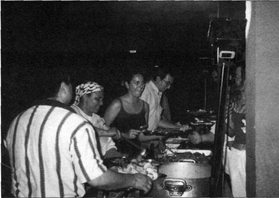
Intercanvi multicultural de cuina.

és cert que les associacions, que han nascut de la voluntat de conèixer, d'entendre, de facilitar la convivència, etc., sempre tindran un paper en aquest món, contínuament canviant, en la perspectiva que cada vegada es facin més coses plegats i no els uns per als altres. D'altra banda, la cosa més natural és que els ciutadans constitueixin associacions amb objectius específics que siguin de l'interès comú dels seus membres i és clar que les persones immigrades, en tant que es reconeixin com a col·lectiu, poden treballar en aquesta línia.