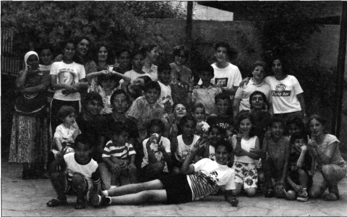
Grup de participants, monitors i monitores en les activitats de lleure intercultural del projecte "Diversitat lúdica" de l'AFAP.

dos joves, home i dona, immigrants per desenvolupar tasques concretes a l'associació: fer de mediadors amb el col·lectiu i d'aquest amb altres institucions de la ciutat (com ara a les escoles, entre el professorat i els pares), i impartir classes d'àrab als infants magribins. Ja que considerem que valorar la seva pròpia cultura i ajudar a reconèixer la seva pròpia identitat permet una millor interrelació i integració: ens relacionem amb l'entorn des d'allò que som.