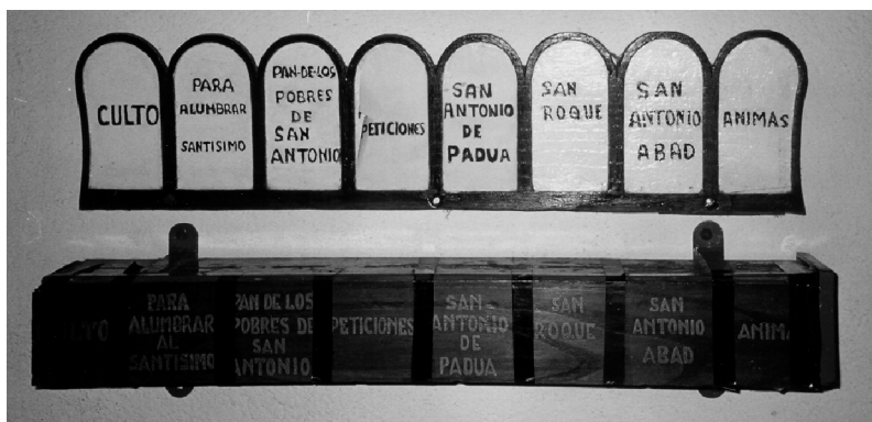
Bacins que els localitzaven a les portes de les esglésies.

pital es preocupava per l'ensenyament. El Consell de la Vila contractava els mestres i els seus sous eren pagats entre l'hospital i la universitat. En una ocasió, l'hospital oferí una casa de la seva propietat situada al mateix carrer de Sant Bartomeu perquè s'utilitzés com a escola.