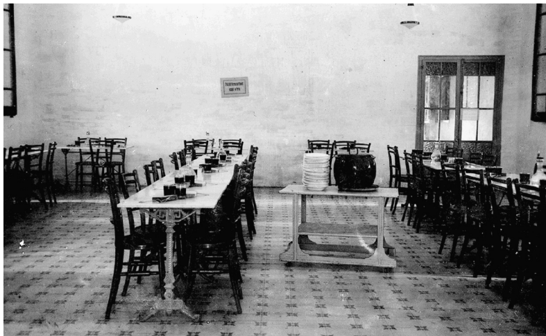
Menjador de la Societat de Beneficència Igualadina.

com a Casa de Jaume de Déu, possiblement d'iniciativa particular. Més tard, tenim coneixement d'altres cases de caritat situades als carrers de Sant Lluís i de l'Aurora.