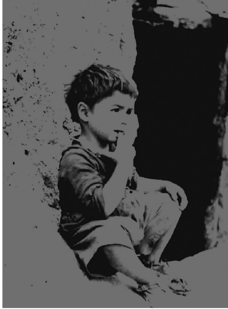
Sèrie «Pobresa», d'Ignasi Castelltort Miralda.

de la pobresa. L'esmentada disposició possibilità la creació a Igualada de la primera junta municipal de beneficència. Les segones lleis en importància no s'elaboraren fins al 1849 i el 1852. Aquestes lleis eren més centralistes i intervencionistes i promulgaven una organització piramidal presidida per la Junta General de Beneficència, que es dividia en provincial i local.