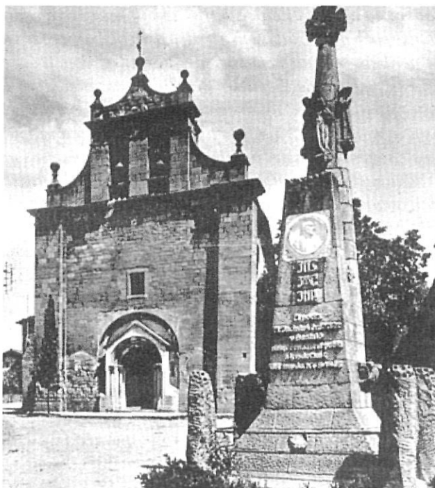
Monument a Mossèn Cinto a Folgueroles

Aquest és el text autògraf i signat per Jordi Pujol, a la Casa dels Canonges, el 8 de desembre de 1980.