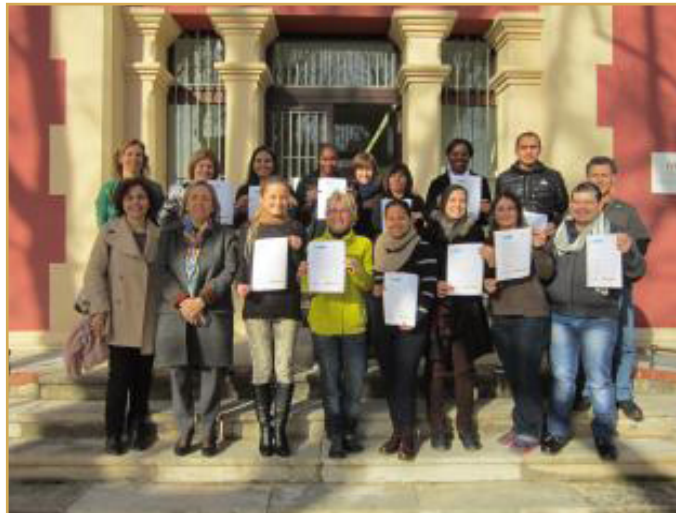
Foto 1: Alumnes de l'Aprèn.cat del CNL de l'Àrea de Reus amb els certificats de final de curs

Gràfic 2: