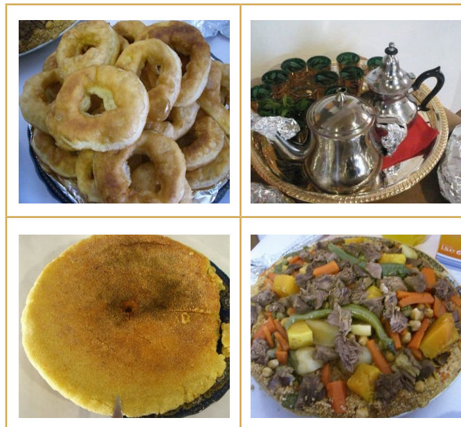
Foto 4: Plats preparats pels alumnes de l'Aprèn.cat del CNL de Terres de l'Ebre a Tortosa

»Esperem tenir l'oportunitat de continuar cooperant en el futur en aquest programa.»