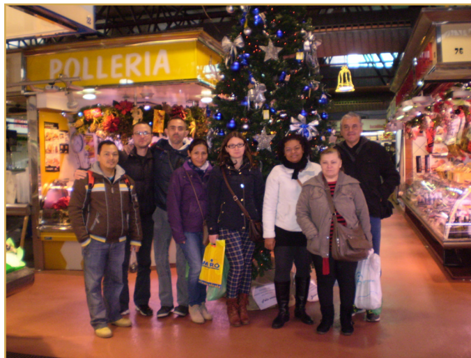
Foto 3: Sortida dels alumnes de l'Aprèn.cat del CNL Vallès Occidental 3 al mercat de Badia