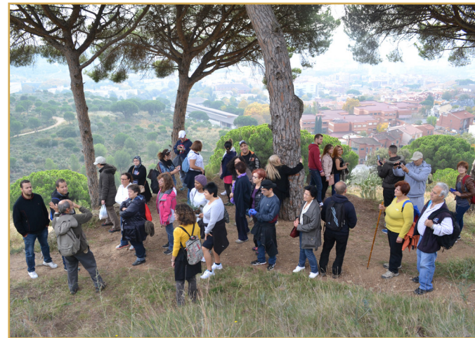
Foto 2: Sortida dels alumnes dels cursos de l'Aprèn.cat del CNL L'Heura a la serralada de Marina, Santa Coloma de Gramenet

Les activitats docents s'han complementat amb activitats de coneixement de l'entorn, com és habitual en els cursos d'acolliment del CPNL, i amb activitats relacionades amb la cerca de feina. Aquestes activitats permeten, d'una banda, que els alumnes coneguin millor les poblacions on viuen, els serveis públics principals (sortides a biblioteques, mercats, museus, etc.) i el patrimoni cultural o natural. D'altra banda, les activitats fora de l'aula ajuden a cohesionar el grup perquè faciliten el coneixement entre els alumnes més enllà de la dinàmica de classe. Finalment, pel que fa a les activitats centrades en visites als centres o a les empreses municipals d'ocupació, l'alumnat percep d'una manera directa que el curs de llengua està relacionat amb les seves necessitats d'ocupació.