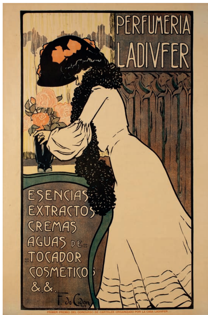
Fig. 3. Perfumeria Ladivfer , 1903. Barcelona, Museu Nacional d'Art de Catalunya.

medalla de plata (en artes decorativas). En Madrid fue alumno de Sorolla 26 y frecuentó el Museo del Prado. En 1905 fue elegido nuevamente delegado de la exposición nacional que se preparaba para el año siguiente. Participó en esta y una larga serie de exposiciones oficiales (entre ellas, Barcelona 1907, 1911, 1918 y 1929, 27 Madrid 1908, 1911, 1925 y 1926 y Valencia 1909 y 1910), así como en muchas otras exposiciones colectivas.