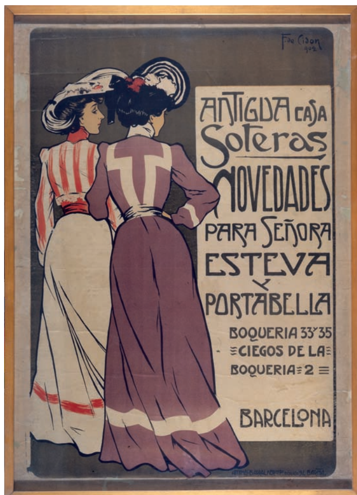
Fig. 2. Antigua casa Soterias , 1902. Barcelona, Museu Nacional d'Art de Catalunya.