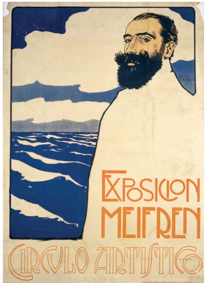
Fig. 1. Exposición Meifrén , 1902. Barcelona, Museu Nacional d'Art de Catalunya.

El cartelismo, sin embargo, no fue sólo un arte de la calle. Aunque útil, efímero y producido en serie, entró en las casas de los coleccionistas y en las salas de exposiciones con el beneplácito de la crítica, que a menudo elogió el carácter experimental del nuevo género, amén de su capacidad de poner la belleza al alcance de todos. En diciembre de 1896 se celebró en la Sala Parés la primera exposición de carteles organizada en España. Participaron en ella algunos de los nombres extranjeros más des-