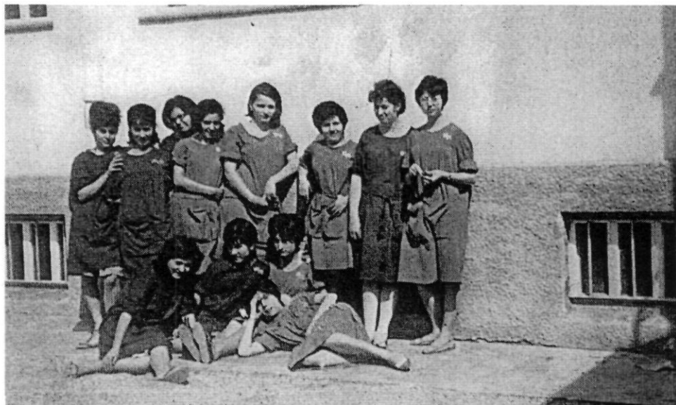
Grup de les primeres treballadores