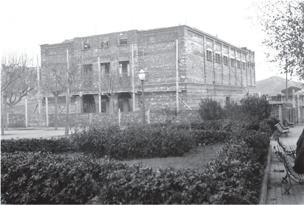
Construcció de La Sala, 1945.