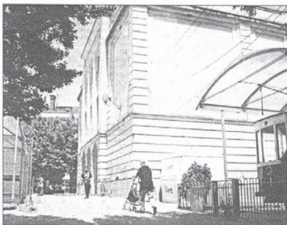
La Sala Argentina està situada a la plaça Nova, on abir es demuntaven els estands de la fira comercial.