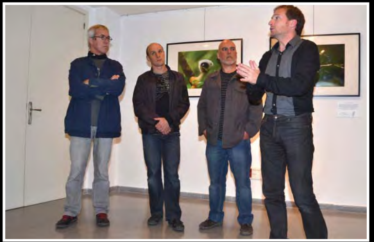
Inauguració de la exposició de Madagascar de l'Iñaki Relanzon.