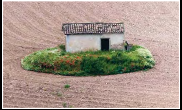
"Caseta agrícola", de Lluís Bagan exposada a l'aparador de la Cambra Agrària.