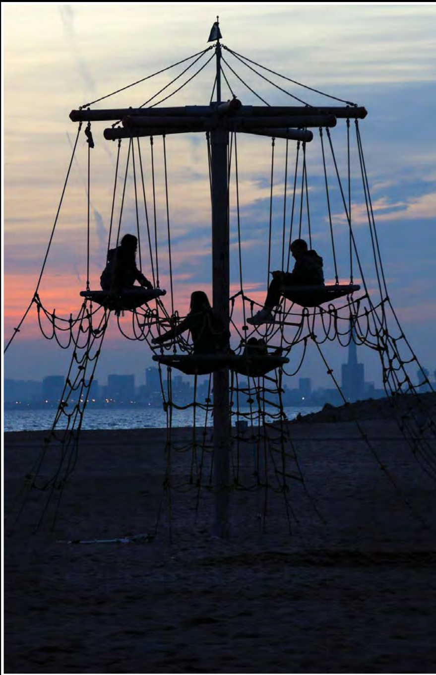
“Gaudint del capvespre”, fotografia de Mike Gavin exposada a l’aparador d’Instant Fotografia.