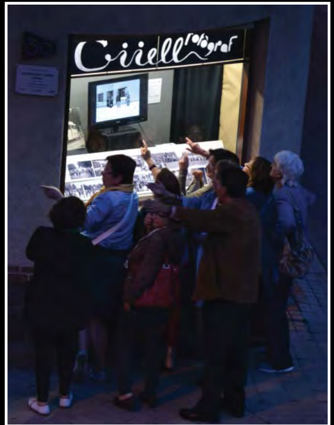
Aparador d'Alfons Güell. Projeccions nocturnes.