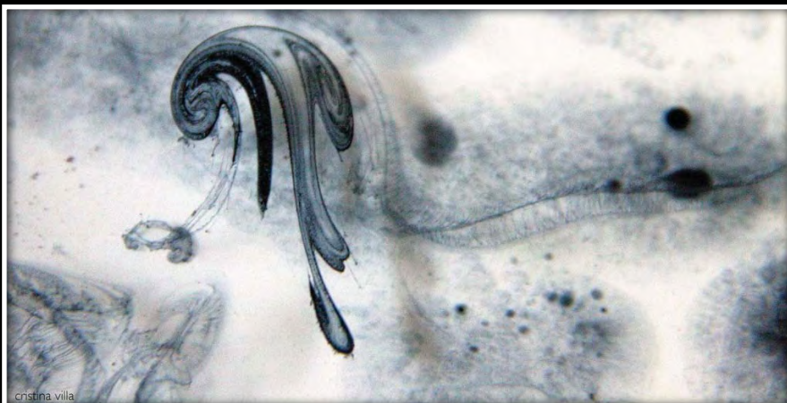
“Ésser d’aigua”, fotografia de Cristina Villa exposada a l’aparador de l’Estanc