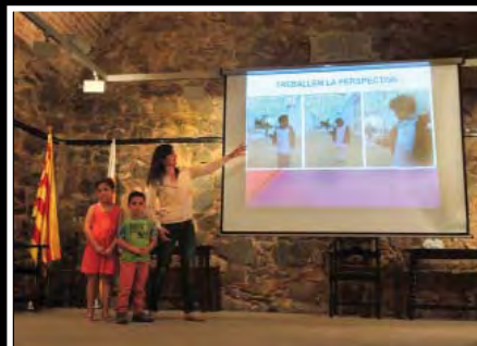
Treballem la perspectiva, treball presentat per l'Escola l'Aixernador.