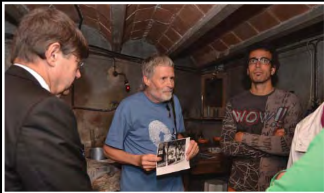
Visita al laboratori fotogràfic d'Alfons Güell.