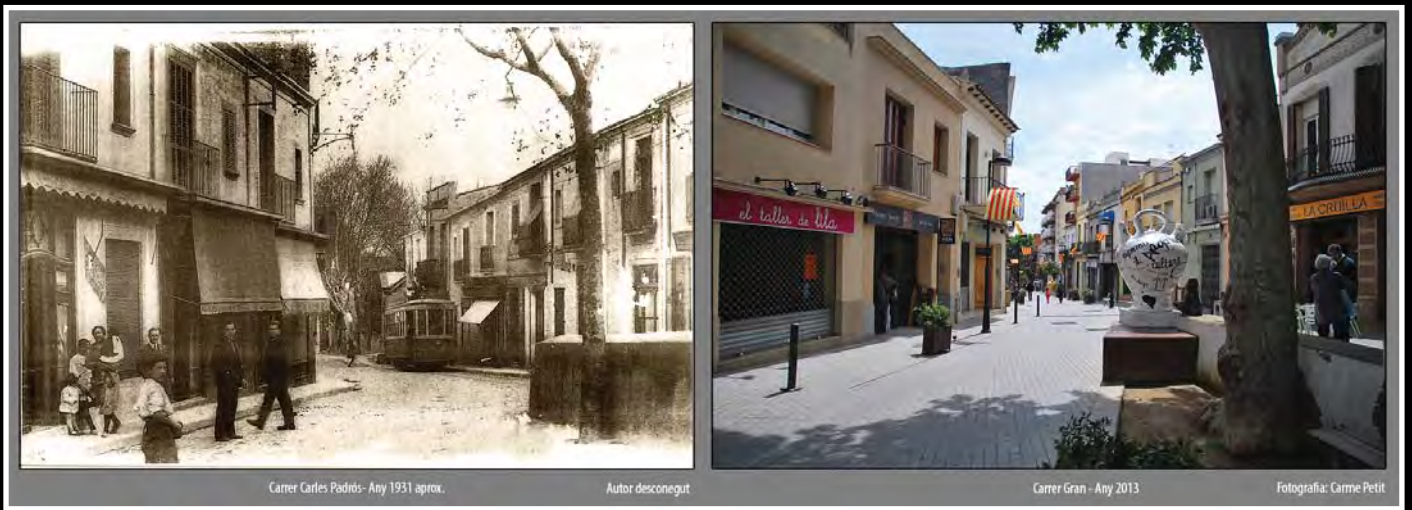
Carrer Carles Padrós- Any 1931 aprox.