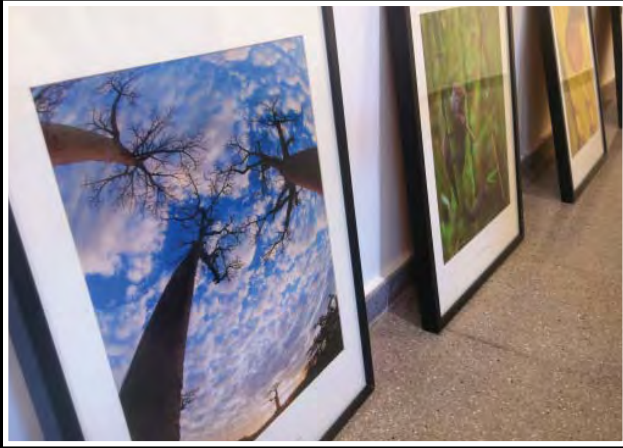
Muntant l'exposició de l'Iñaki Relenzón a la Casa Gòtica. . Foto: Toni García