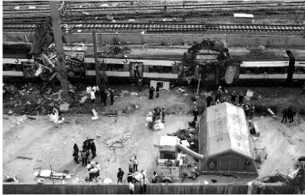
Centre mortuori temporal

Es va fer un reportatge fotogràfic i un enregistrament en vídeo de la zona amb propòsits forenses i es va autoritzar Protecció Civil a instal·lar un centre mortuori temporal que acollís els cadàvers una vegada l'autoritat judicial en determinés l'aixecament.