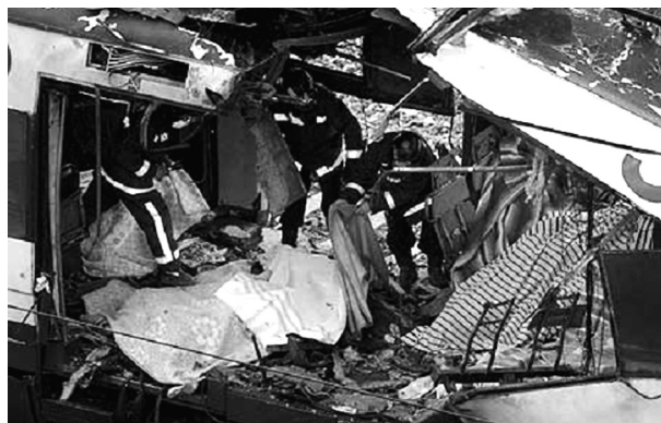
Els bombers fan un estudi tècnic de la situació i compten els cadàvers

Una vegada els TEDAX van haver inspeccionat la zona, fins que va arribar la Comissió Judicial i els tècnics de la Policia Científica es va autoritzar els Bombers perquè fessin un estudi tècnic de la situació i un recompte de cadàvers. L'objectiu era anar dissenyant una visió operacional conjunta (COP).