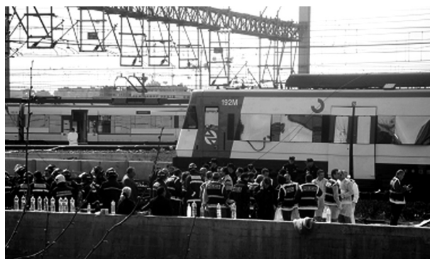
Es donen les primeres instruccions

contactava amb el Centre Operatiu de Comunicacions de la Policia, amb els responsables dels TEDAX i de la Policia Científica, i amb especialistes d'altres serveis d'emergències que estaven operant de manera autònoma sobre el terreny (Policia Municipal, Emergències Sanitàries, Bombers, Protecció Civil i Creu Roja). Es van donar instruccions sobre el procediment que calia seguir per recuperar els cadàvers. D'aquesta manera, es va visualitzar i interioritzar la figura d'un comandament operatiu unificat de gestió de l'incident.