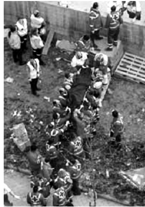
En la recuperació i el trasllat dels cossos la coordinació és absoluta