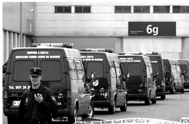
Trasllat de les víctimes mortals al pavelló núm. 6 d'IFEMA

Els cadàvers finalment van ser transportats a una localització centralitzada, comuna a tots els focus del sinistre de l'11-M (pavelló núm. 6 d'IFEMA).