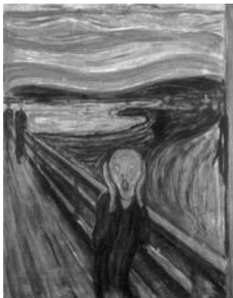
Figura 1. El Crit . Edvard Munch.

Tractant-se de societats complexes, on tot està estretament interrelacionat, la gran qüestió és com ens podem protegir de la nostra pròpia irracionalitat. Els encađenaments catastròfics davant dels quals ens hem de protegir resulten de la nostra irresponsabilitat per témer massa o massa poc.[...]