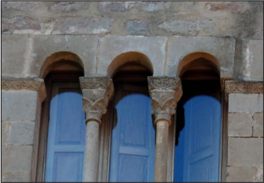
Fig. 3 - Detall de la finestra coronella (s. XIII).