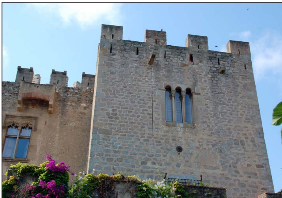
Fig. 2 - Vista general de la torre del s. XIII