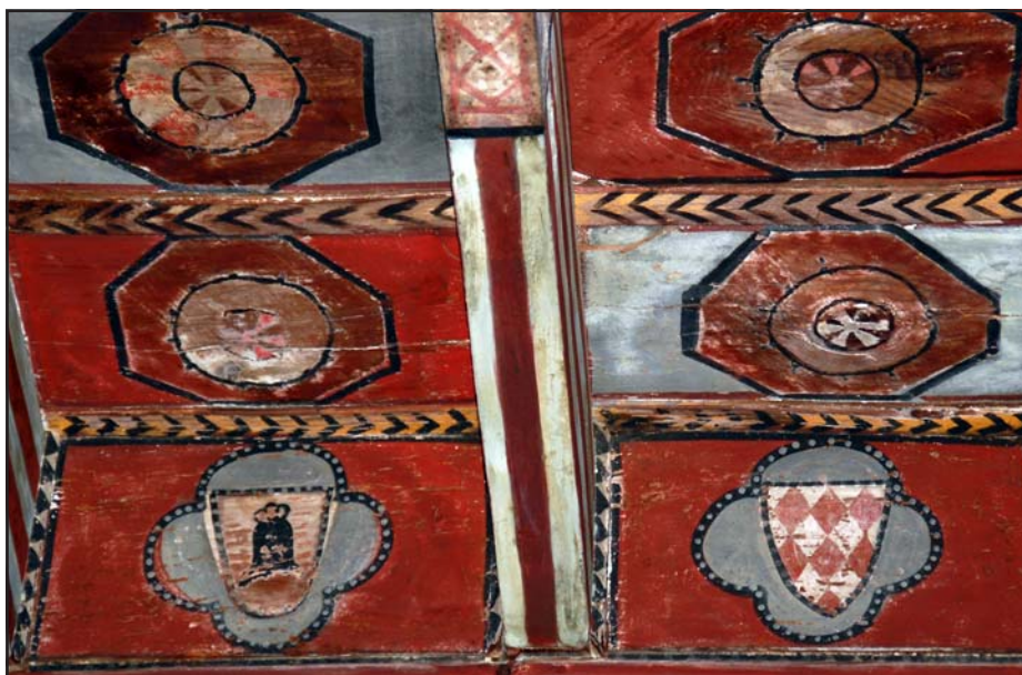
Fig. 5 - Detall del teginat del s. XIII on es pot observar l'heràldica dels Sant Vicenç i dels Centelles [Fotografia J. Graupera]