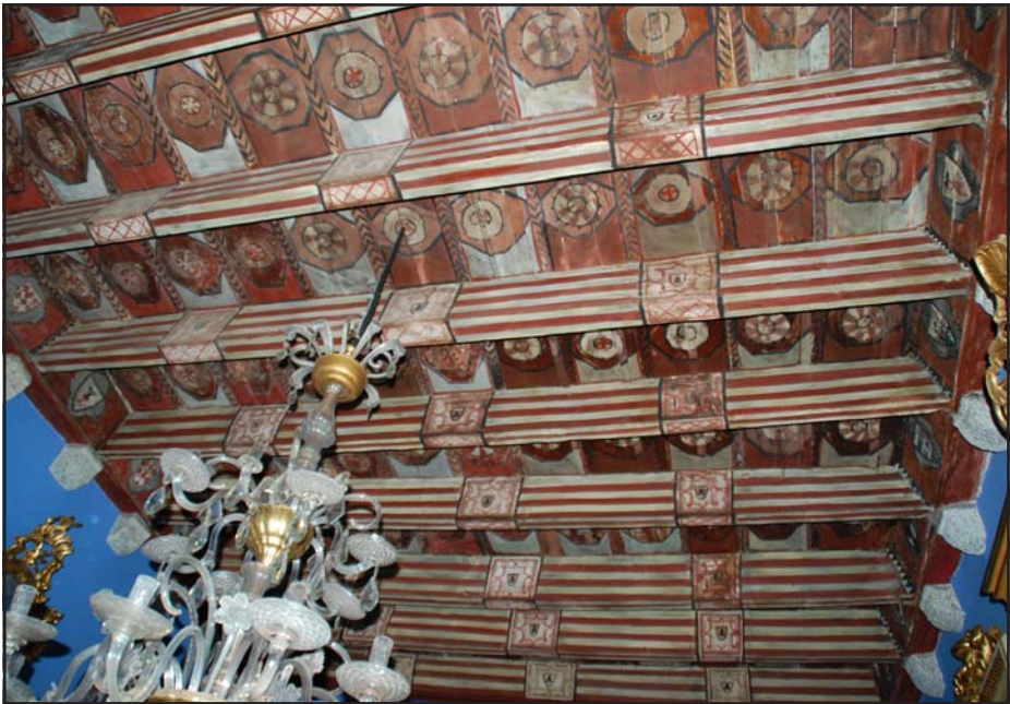
Fig. 4 - Vista general del teginat del s. XIII.