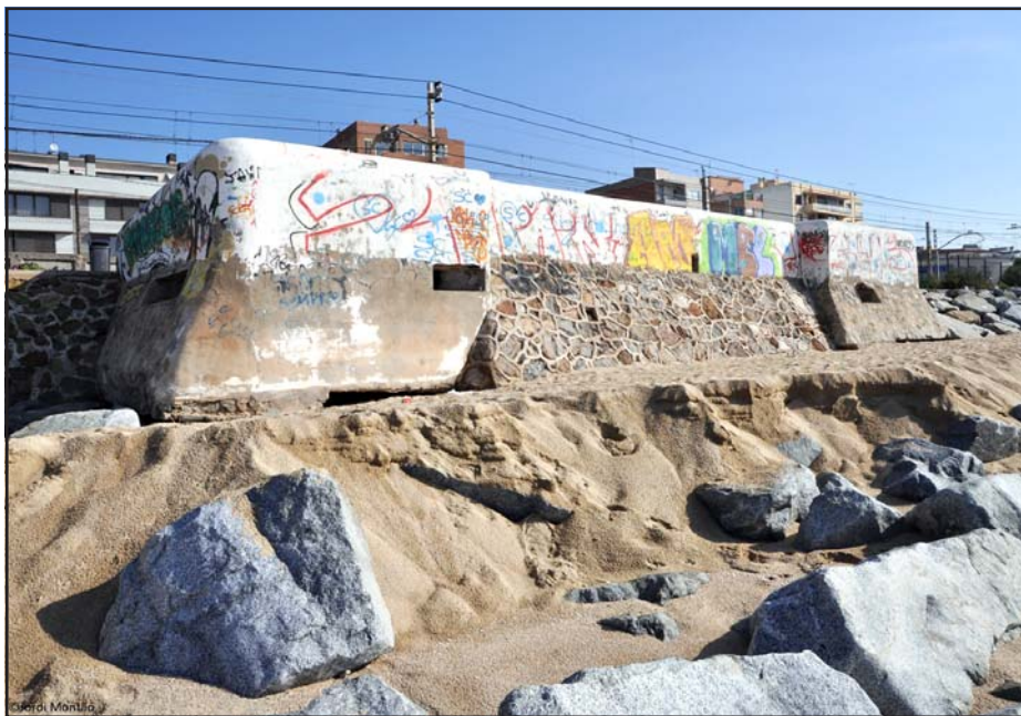
Búnquers PRM010 i PRM011, any 2010.