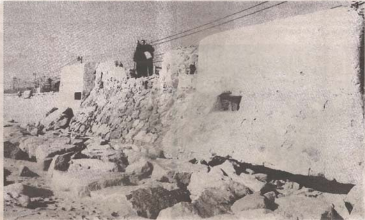
El president i el secretari del barri del Gas mostren els desperfectes a la barana que uneix les dues espitlleres del búnquer.