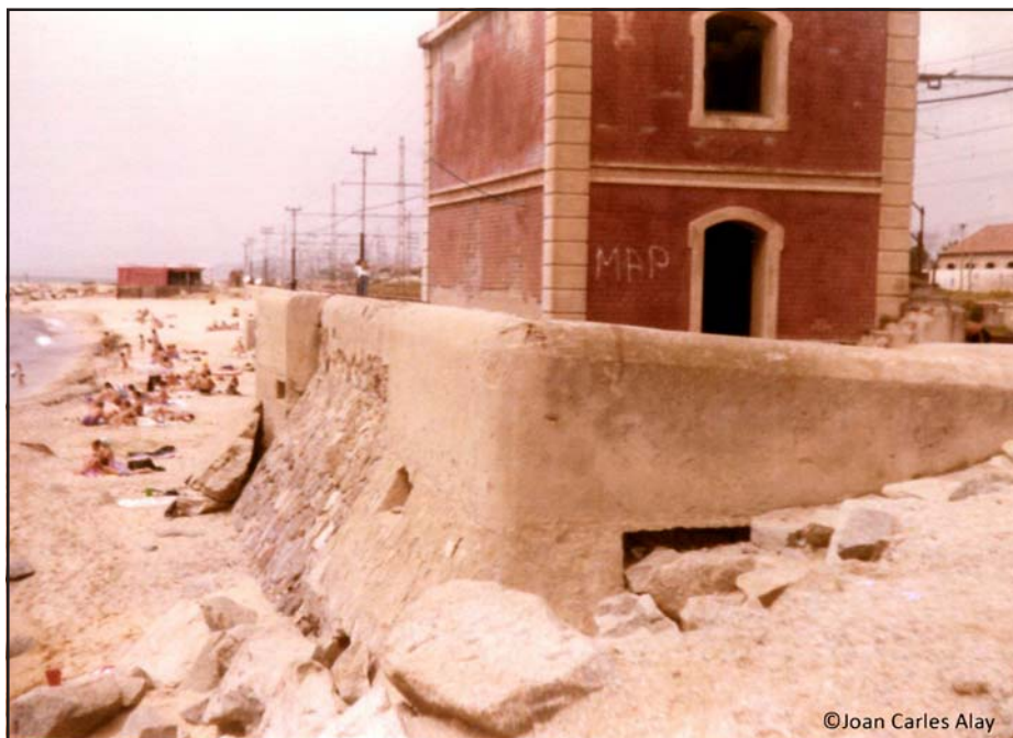
Búnquers PRM011 i PRM010, any 1980.