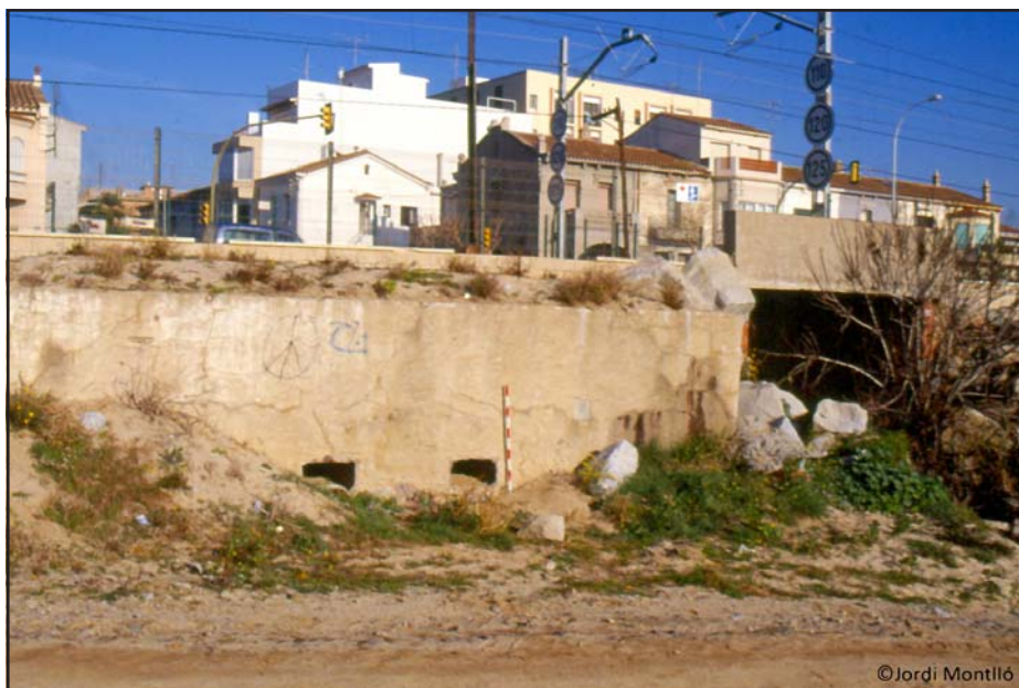
Búnquer PRM013, any 1998.