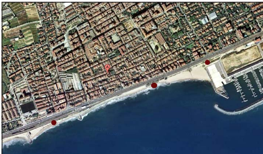
Situació dels búnquers documentats a Premià de Mar.