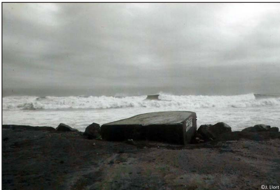
Búnquers PRM012.