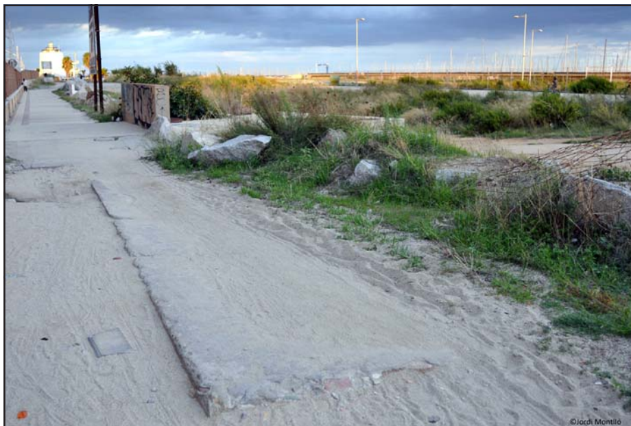
Búnquer PRM013, any 2010.