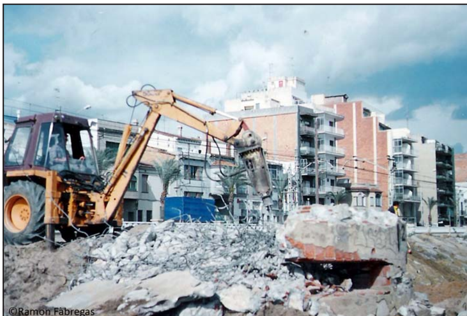
Búnquer PRM012, any 1992.