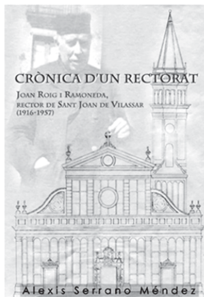
Portada del llibre