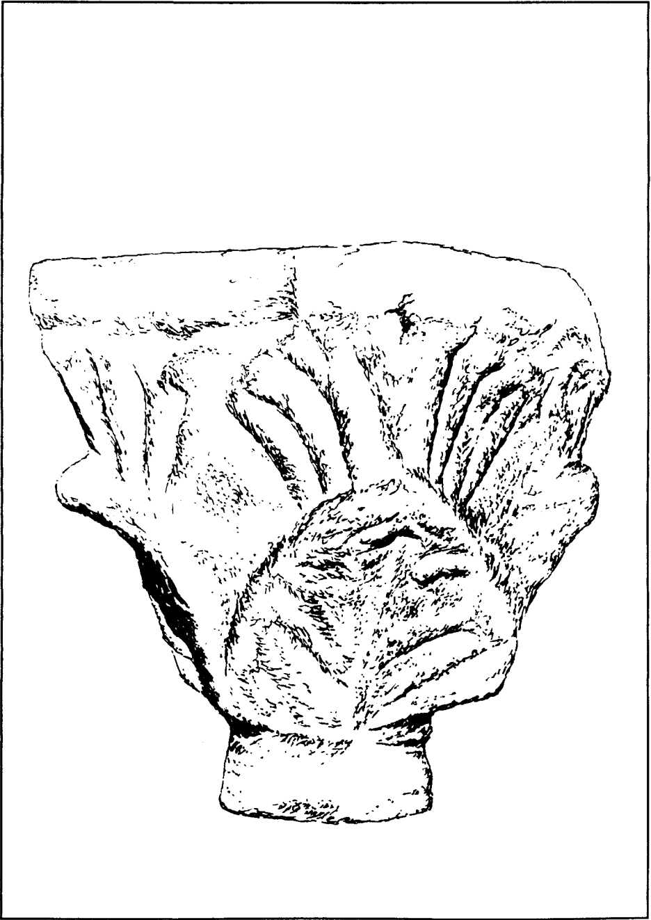
Capitell de Sant Martí d'Arenys de Munt (dibuix: E. Juhé).