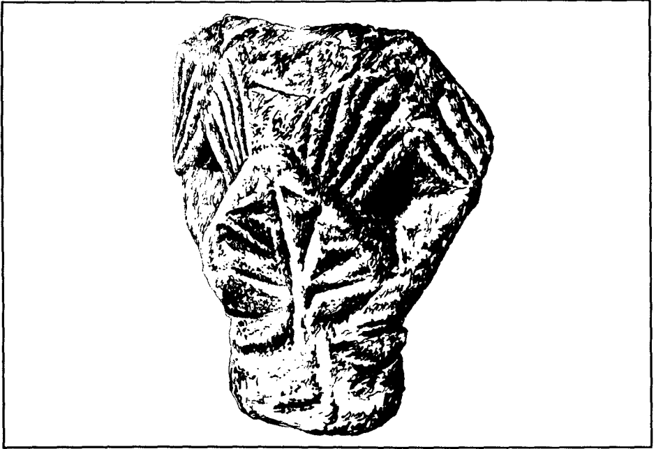
Primer capitell de can Peixau de Badalona (dibuix: E. Juhé).