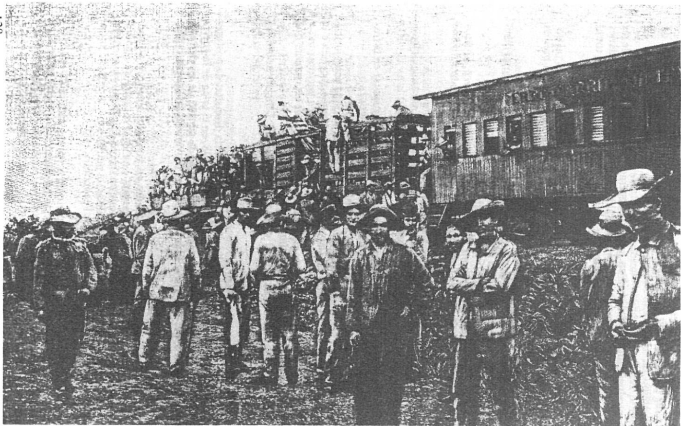
Dos-cents cinquanta mil soldats espanyols no foren utilitzats a fons a la guerra amb els nord-americans a l'illa de Cuba. Historia General de España . Vol. IX, p.125. Ed. Planeta, Madrid. 1980.