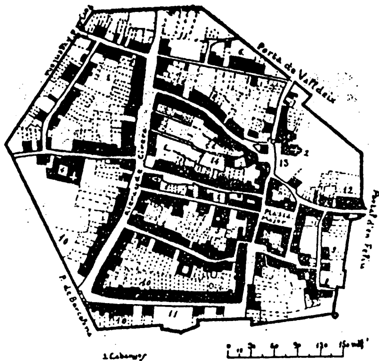
Plànol de Mataró a les acaballes del segle XVI