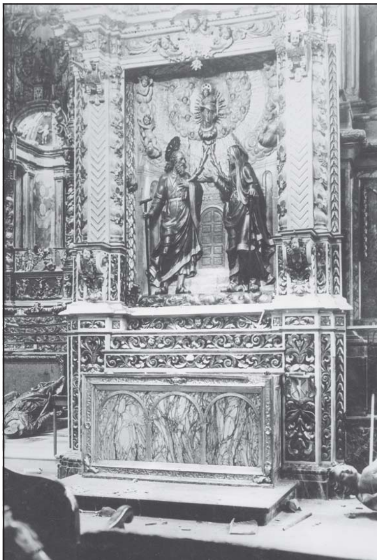
Retaule de Sant Joaquim i Santa Anna, quan es començava a destruir (juliol o agost de 1936).