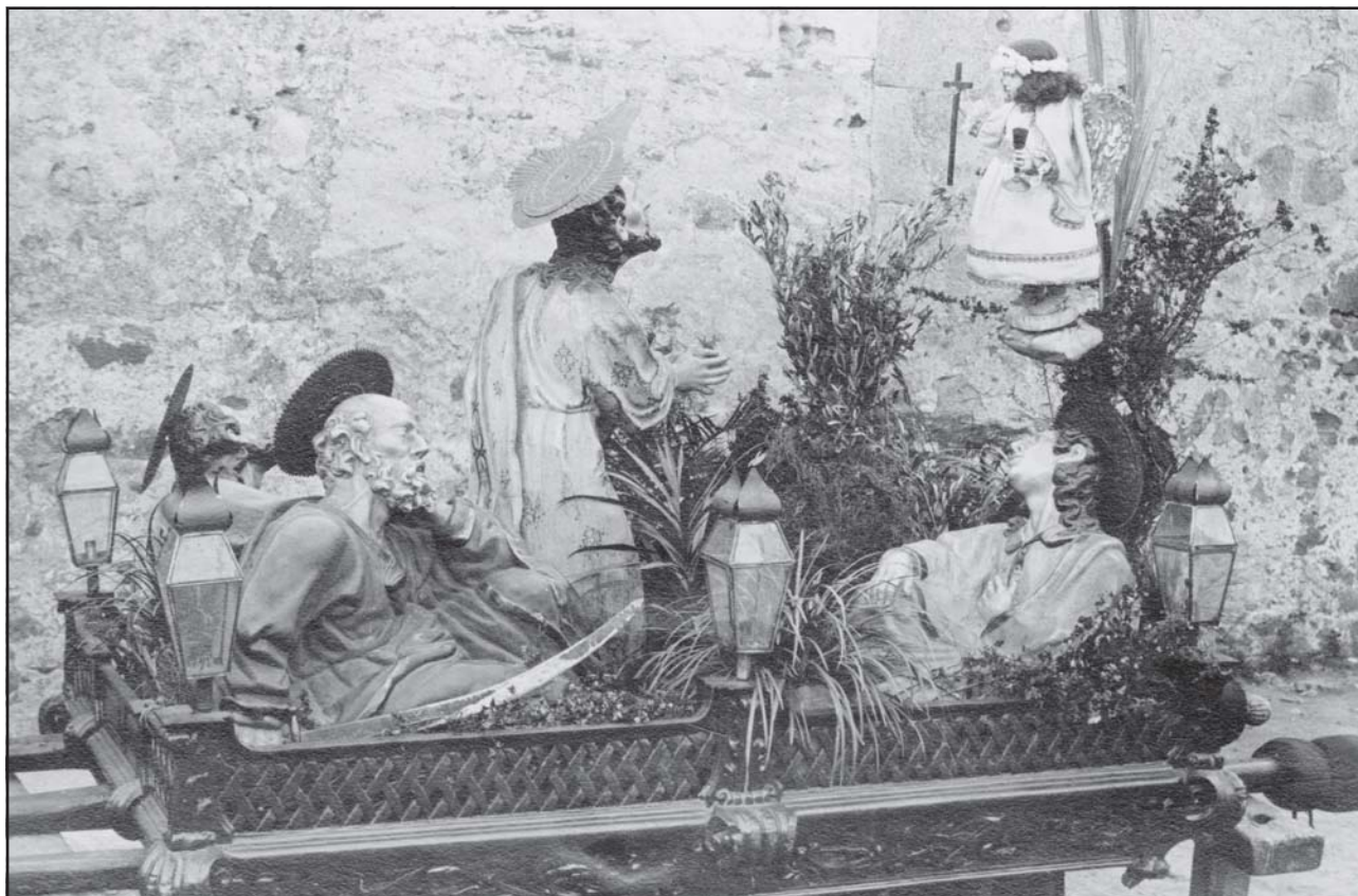
Misteri de l'Oració a l'Hort, de la processó del Dijous Sant. (c. 1930).

dies de l'avís de malaltia. «Si la malaltia pasa de vuit dies se li farà un jornal cada dia fins al dia setse, això és, vuit jornals seguits, si pasa dels vuit y no arriba a setse se li abonaran tans jornals cuans dias pàsia dels vuit» (Capítol 7). «Passats los setse dias se abonaran y faran al germà malalt la mitad dels jornals que pèrdia, això és, la mitad dels dias de feyna fins arribar al mitg any de estar malalt: pasant del mitg any fins arribar al cap del any se faran al germà la quinta part dels jornals que pèrdia, això és sinch dias de feyna se li farà un jornal. Cuan la malaltia pàsia del any se ajudarà al germà a rahó de trenta jornals lo any a pro rata» (Capítol 8). «Cuant mort un germà si la malatia ha durat més de un any en que se li hagut de assistir, no se assistirà a la viuda en cosa alguna, però sino se ha assistit al germà més de un any, a la viuda se la assistirà per espay de un any, a rahó de trenta jornals».