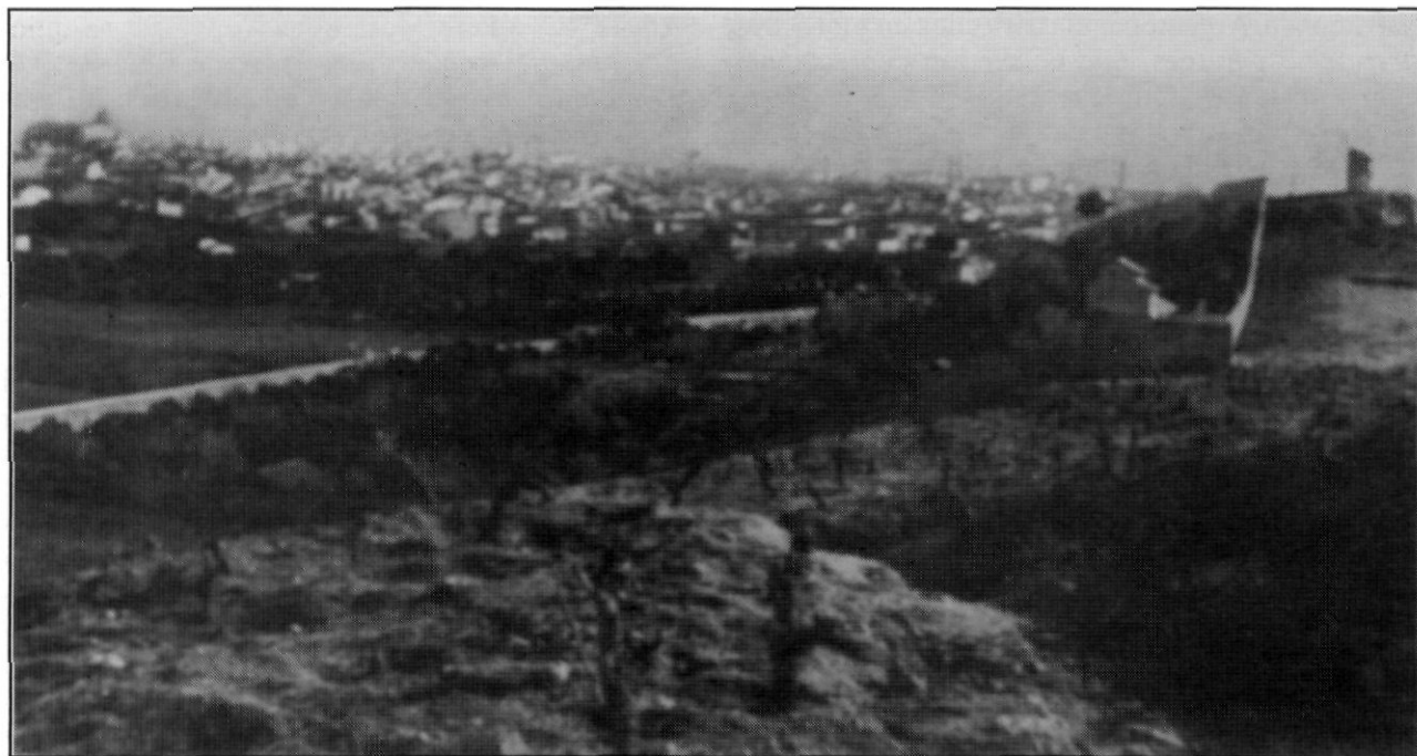
Panoràmica de Mataró a l'any 1887. A la dreta, hi figura la torre del Molí de Vent. JOSÉ M a PELLICER, Estudios Histórico-Arqueológicos sobre Iluro (Mataró 1887) , làmina.

anomenada de Cogoll depenent del senyor del castell de Burriac 3 . I és que Pellicer en els seus Estudios només s'havia limitat a transcriure el document del 1128 i a publicar les dues panoràmiques de la ciutat, sense fer-hi cap comentari o donar-ne una explicació.