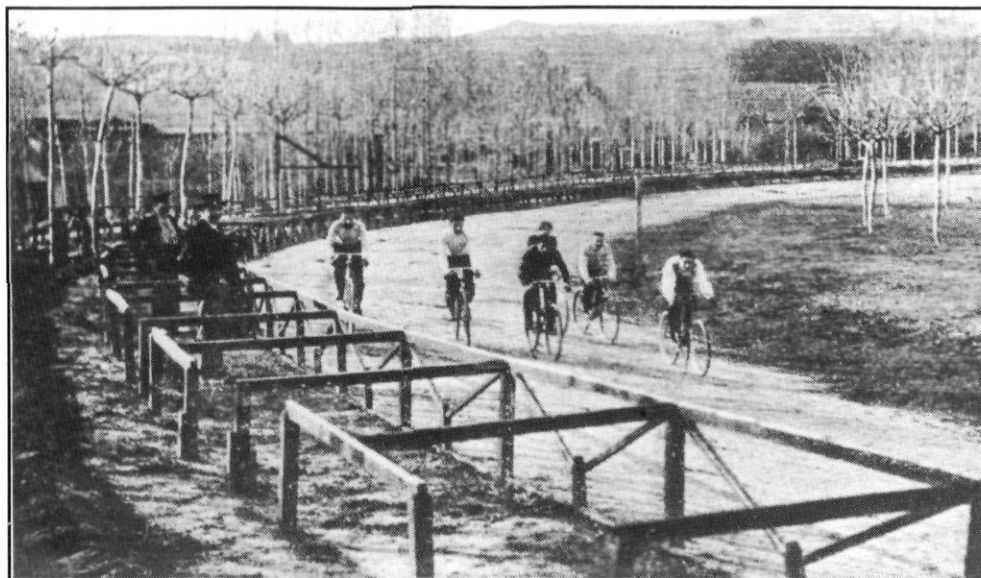
Cursa ciclista al Velòdrom, l'actual Parc Central (1905?). Col·lecció Francesc de P. Enrich i Regàs.