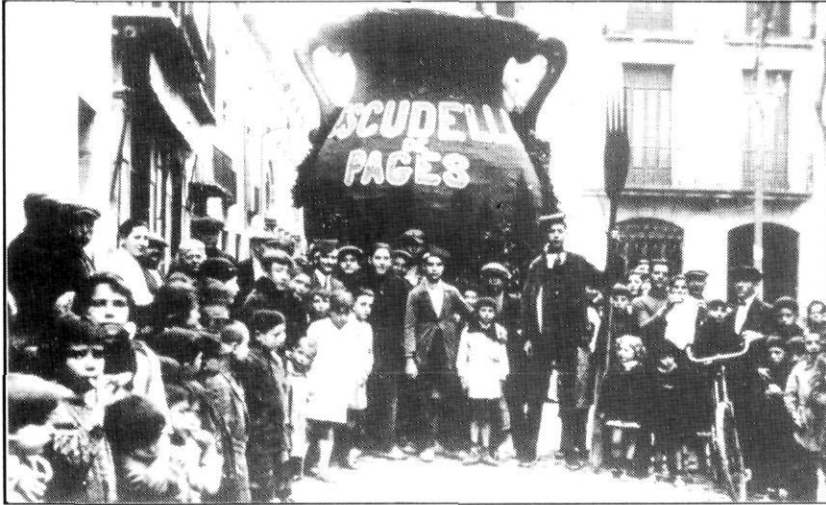
La cavalcada del Carnestoltes a l'inici del carrer d'Argentona.

Al fons, el carrer de Bonaire i la Riera (1925?). Col·lecció Francesc de P. Enrich i Regàs.