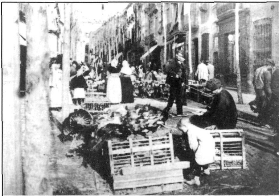
Fira de galls dindis a la Riera (1905?).

Les felicitacions no havien proliferat encara i eren comptades les que es rebien. Una de les tals era la del «sereno», que la passava la setmana anterior al Nadal, quan anava a cobrar a les cases del seu barri o demarcació. Al davant del cromo que servia de felicitació, hi figuraven, a més d'un gravat del propi sereno, el Naixement, pollastres, galls dindis, neules, torròn i ampelles de vins generosos; al darrera, hi havia el vers de consuetud, de mínim valor literari, de manera que per ponderar la ínfima qualitat d'una poesia es deia «sembla el vers del sereno».