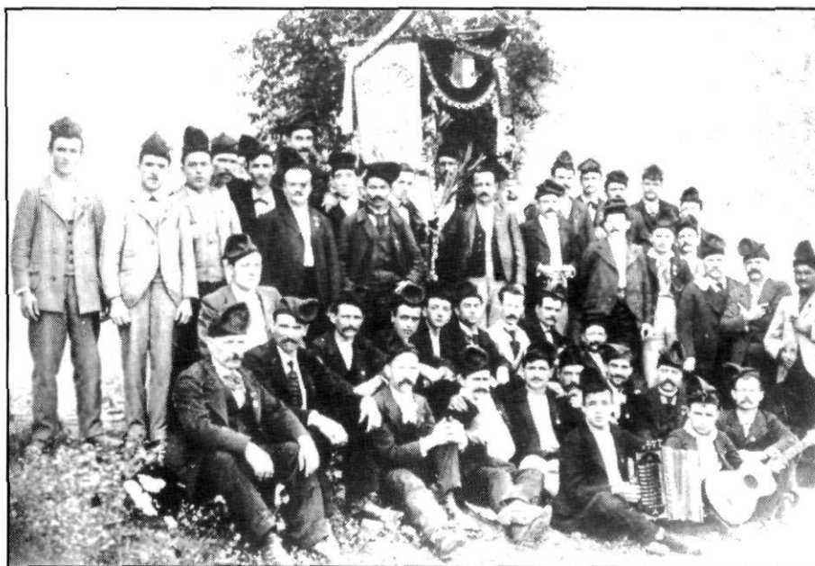
Societat coral «La Palma» (1896?). Col·lecció Francesc de P. Enrich i Regàs. MASMM. Arxiu d'Imatges.

pasta de «sabre», que portaven un ou dur, o dos, i fins i tot, alguna, tres. Encara guardem el record personal de l'obsequi que ens feia la nostra padrina regalant-nos una «mona» de dos ous, i no cal dir la il·lusió amb què l'esperàvem.