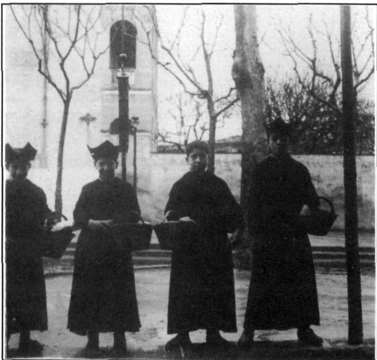
Escolans fent la recapta (1920?).

És convenient de deixar constància de la predicació quaresmal d'aquells dies ja tan llunyans, quan pujaven a la trona oradors de gran categoria, en els quals l'eloqüència s'unia a la profunditat de concepte, i que, mantenint l'atenció de l'auditori de manera constant durant