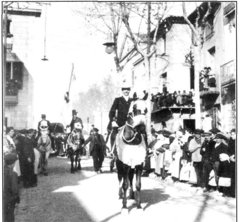
Els Tres Tombs al capdamunt de la Riera, davant l'Ateneu (1905?).

Encara que hem parlat del Carnaval i de les seves festes característiques, per ésser una mena de cicle que té el seu començament una vegada