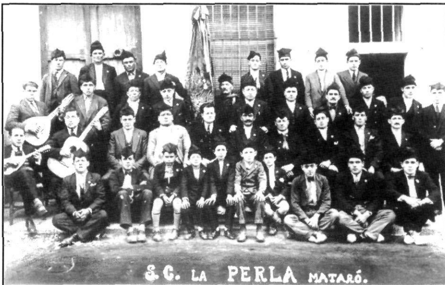
Societat coral «La Perla» (1925?).

De la Pasqua, una característica que no volem pas deixar al tinter és la de les «mones». En general, eren molt modestes comparades amb les d'avui dia. Les de mantega ja es consideraven pròpies dels senyors. La classe treballadora acostumava a adquirir-les de les que se'n deia