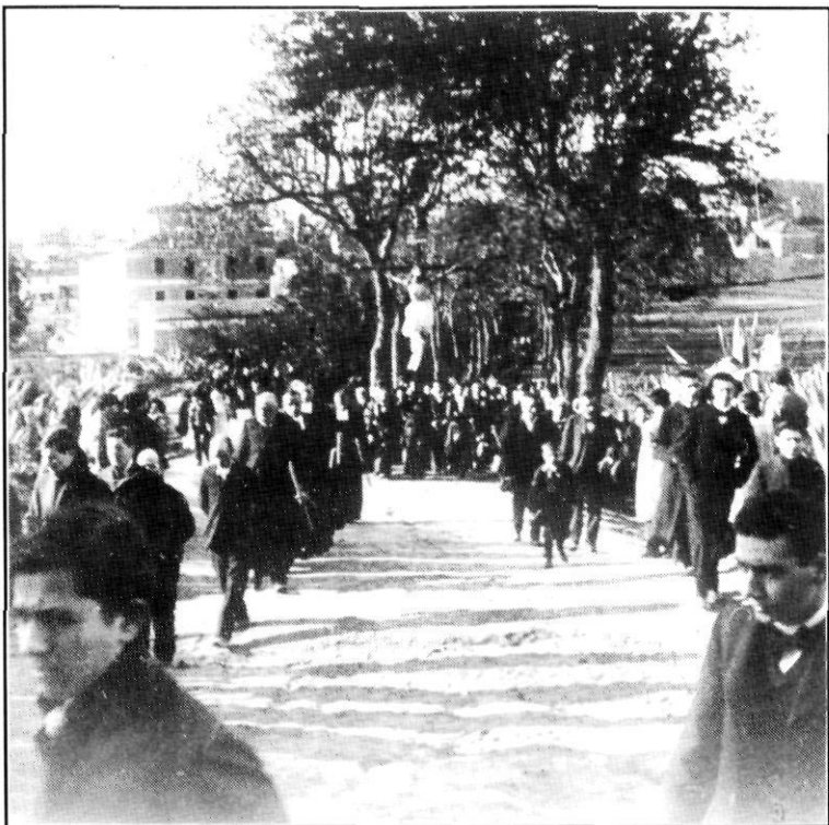
Via Crucis al cementiri (1905?).

Gran quantitat de nois anaven a les esglésies a picar els fasos el dimarts i el dimecres Sant 2 . Uns hi assistien amb els seus familiars i portaven