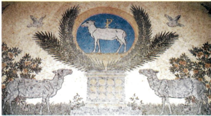
Plafó de l'entrada