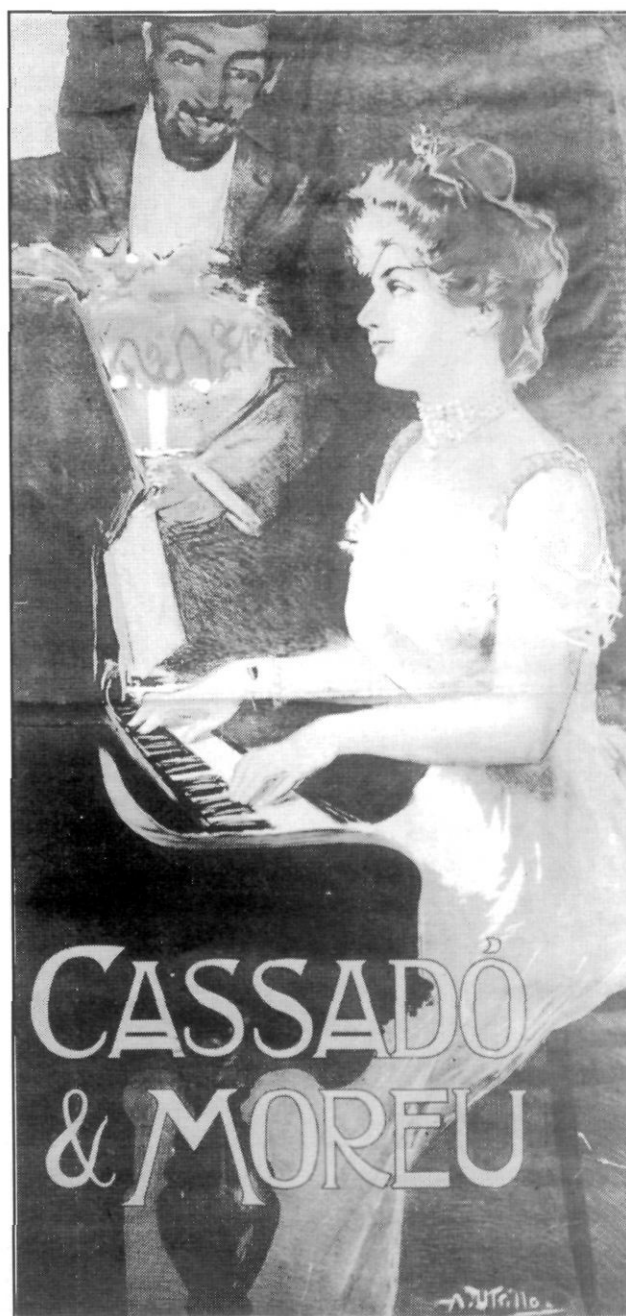
Cartell de l'establiment de pianos Cassadó & Moreu fet per Antoni Utrillo. Museu d'Art Modern de Barcelona.