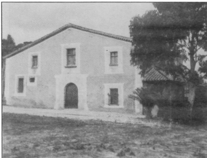
Casa Moreu, al veïnat d'Agell.

Al fons de l'habitació, en una calaixera, es guardava una casulla, l'alba, la patena, les canadelles, etc..., necessaris per celebrar la missa.»