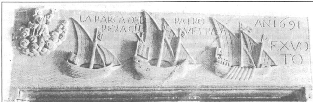
Llinda de la sagristia de Sant Simó.

demogràfic, hi havia arribat al llarg de la dissetena centúria, malgrat uns factors adversos, com la pesta de 1652, la forta mortalitat d'alguns altres anys, les pertorbacions produïdes per la guerra anomenada de «Separació», pel conflicte de les «barretines», o pels diferents brots de guerra amb França. Un semblant desenvolupament es féu ben ostensible al llarg del darrer decenni del segle.