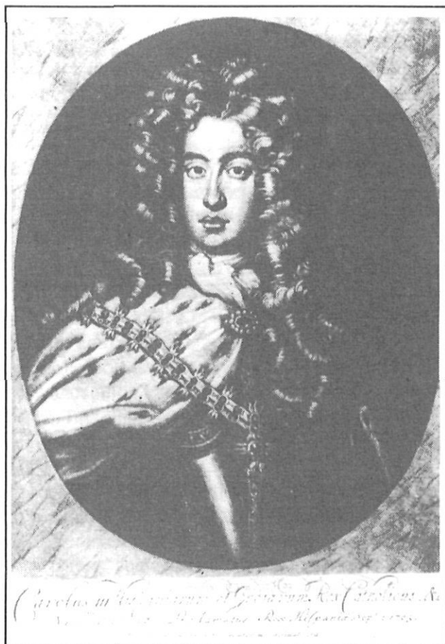
Retrat de l'Arxiduc Carles d'Àustria.