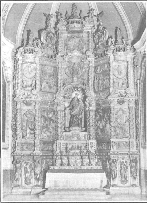
Retable del Roser (1690).

que hom aixecaria la capella de la Mare de Déu dels Dolors, dins d'una nova manifestació de pietat religiosa. L'any 1698 tindria lloc, com ja se sap, la benedicció de la seva primera pedra.