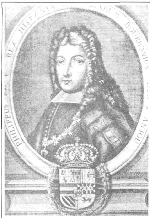
Retrat de Felip V.

mataronines i la seva progressió empresa a últims del segle XVII. L'any 1705 l'arxiduc Carles d'Àustria amb el nom de Carles III d'Espanya, arribava a Catalunya amb el propòsit d'emprendre des d'ací la conquesta del tron espanyol que havia reivindicat. Li prestaven suport les potències de la Gran Aliança de la Haia que no havien acceptat les disposicions testamentàries de Carles II de cedir la seva corona a Felip d'Anjou (Felip V d'Espanya).