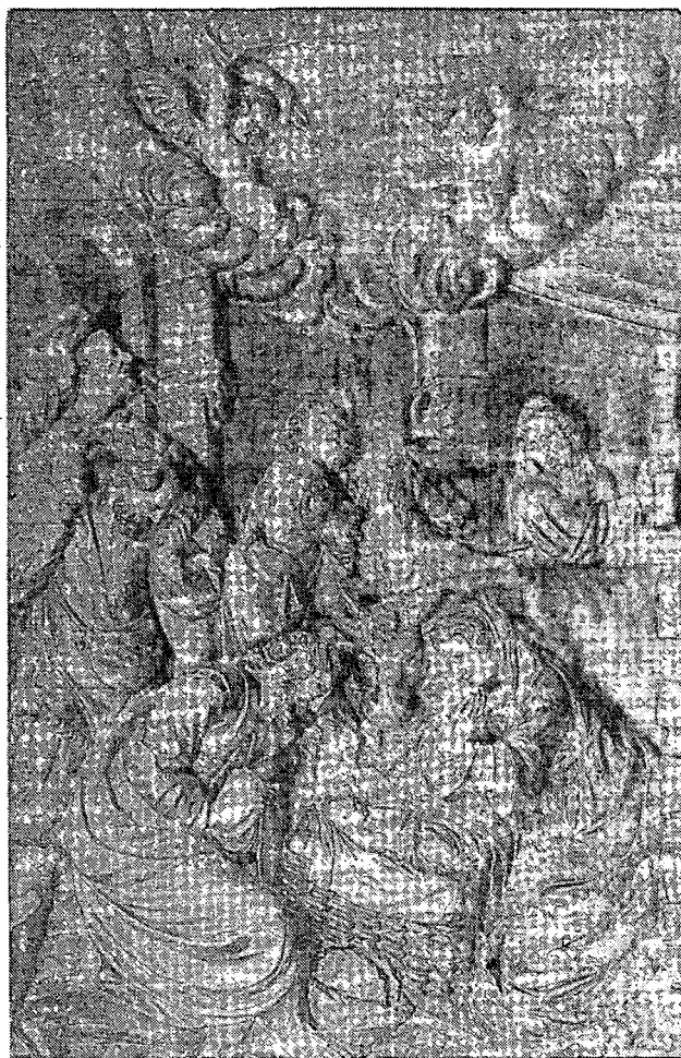
Retaule del Roser. El Naixement.

Però encara que globalment podem considerar com acabat el daurat del retaule, resten petites parts i algunes peces que no ho són. Força temps després es paguen quantitats no massa importants a Francesc Manent, el 1710 per daurar los baixos (15) i el 1711 sense especificació (16). Finalment, el 1712, se li paguen 9 lliures per aver daurat la Mare de Déu del Altar y fer-li la corona (17), quantitat que sembla molt exigua per una peça tan important i, a més, realitzada magistralment. El daurat i policromat del retaule finalitza, per tant, amb la imatge titular.