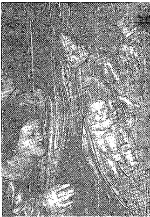
Retaule del Roser. Detall de la Presentació.