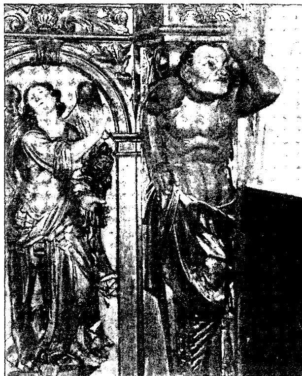
Retaule del Roser. Dos atlants.

sió dels seus muscles. Aquest tipus d'atlants —amb expressió d'esforç físic, com si suportessin el retaule— seran més freqüents des de principis del segle XVIII, però no abans d'esculpir-se aquest retaule, per la qual cosa deuen ésser dels primers en el barroc català. No ho afirmem perquè han desaparegut molts retaules barrocs a Catalunya.