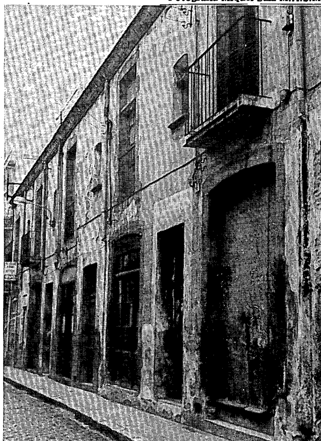
El carrer d'Amàlia.