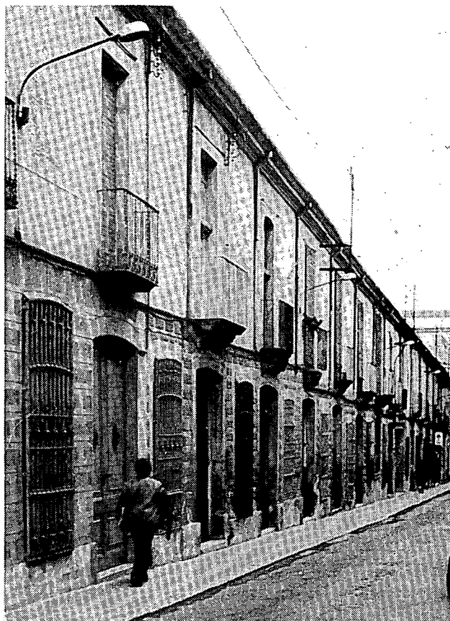
El carrer de Sant Agustí.

Tots hem coincidit —no podia ésser altrament— en la preocupació per respectar les tipologies constructives històriques de cada localitat i no mixtificar-les; en l'interès per l'alineació de les cornises, pel domini del ple sobre el buit, en la reglamentació de les mides màximes de les obertu-