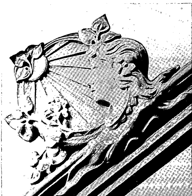
Element decoratiu d'una botiga del carrer de St. Josep. Símbol del Patrimoni Arquitectònic Mataroní. Extret de la Memòria Històrica del Pla Especial del Catàleg.

ser capaç de donar una imatge pròpia del seu temps, específica del seu caràcter democràtic, tant pel que fa a l'obra pública com a l'edificació privada. Com vaig dir en un altre lloc, es tracta de fer "palesa la voluntat de construir una ciutat a la mida del ciutadà, on l'espai públic, el carrer, la façana, l'escenari de la nostra vida col·lectiva, sigui considerat com a quelcom positiu, digne d'atenció i de respecte, significatiu d'allò que és la ciutat, útil i agradable per a l'usuari, com a manifestació que a la ciutat democràtica el protagonista és la col·lectivitat, el públic, el comú, com a la ciutat absoluta ho era el príncep, l'absolut".