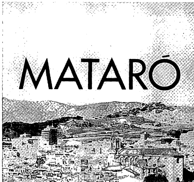
Memòria Històrica. Pla Especial del Catàleg del Patrimoni Històrico-Arquitectònic de Mataró. Mataró, 1981.

“ghettos” residencials com més lluny millor del centre, amb la inevitable degradació d’aquest. Tots aquests fenòmens al nostre país es conjuminen amb un règim polític dictatorial, amb la manca d’institucions locals democràtiques. Aquest és el model de ciutat contra el que, com deia al principi, es comença a reaccionar, —pel que fa a l’arquitectura i a l’urbanisme— amb el crit d’alarma, amb l’element aglutinador de la defensa del patrimoni arquitectònic, arqueològic i ambiental.