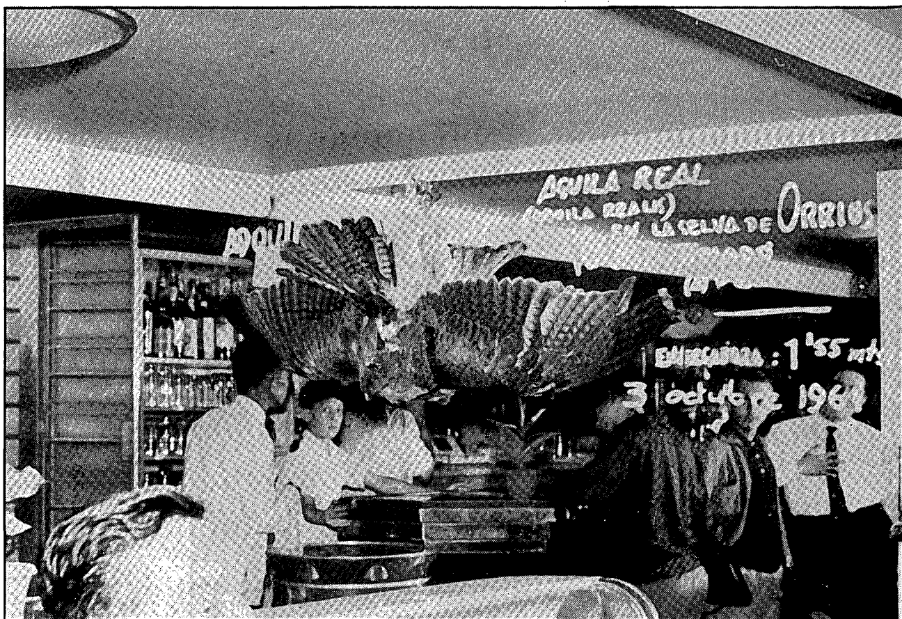
Una àliga reial caçada "a la selva d'Orrius" és exposada al Bar Canaletes, el 3 d'octubre del 1961.

A l'any 1956 es va produir la darrera reforma, que afectà ostensiblement la distribució interior de l'establiment. L'increment de bars amb la barra llarga o barra "americana", va influir a moltes cafeteries a fer reformes, ja que implicava una nova forma de funcionament i de servei al públic. La barra es va col·locar al costat de la muralla, amb una llargària d'11 metres, amb un mirall al fons, que cobria tot el pany de paret, produint un efecte de llargària al local, donant la sensació que es podia sortir per l'altre costat. Davant la barra