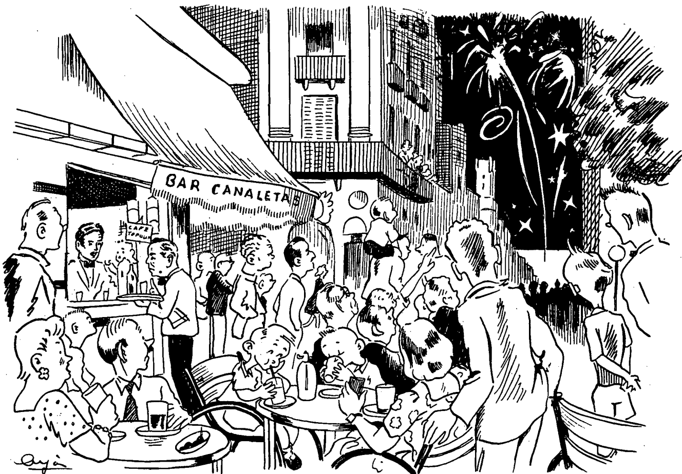
Els focs de les Santes des del Bar Canaletes. Any 1955? Dibuix de Cuyàs.

El treball que segueix explica els seus inicis i la seva petita història.